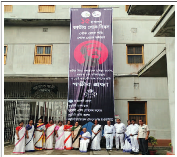
Paying respects by the residents of Kumudini Complex, Mirzapur, Tangail.