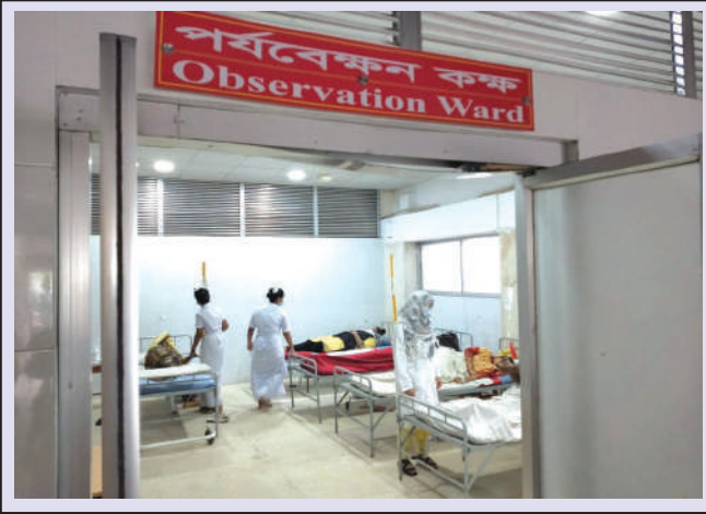
Observation Ward for patients who need immediate attention.