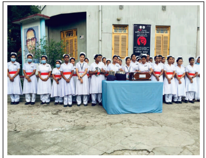
Performing National Anthem and patriotic songs by the students of Kumudini Nursing College.