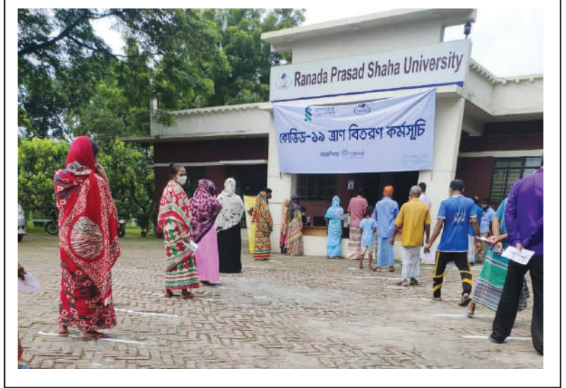
People are at queue maintaining physical distances for relief at Ranada Prasad Shaha University premises at Shitalakhya.

It may be mentioned that last year also Kumudini distributed relief materials among 5,000 helpless people during the Covid-19 pandemic and floods. The distribution was among the nine wards of Mirzapur Municipal area and 13 Unions of this Upazila. It was also a joint venture between the Standard Chartered Bank and City group. The relief supplies included food and essential medicines.