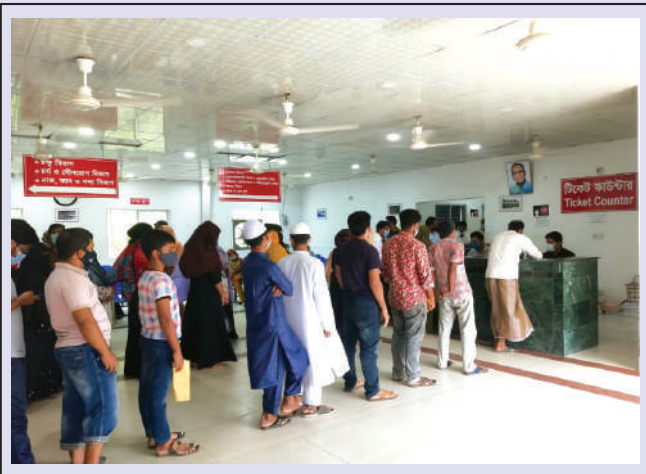
OPD Ticket Counter.