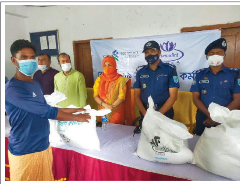
Each gets a packet of 10 kg of rice, 5 kg of salt, 1 kg of sugar, body and laundry soaps as relief.

Kumudini's tradition of philanthropic work of distributing relief materials among thousands of helpless families in this disaster in Narayanganj is a continuation of its legacy of service to humanity. ●