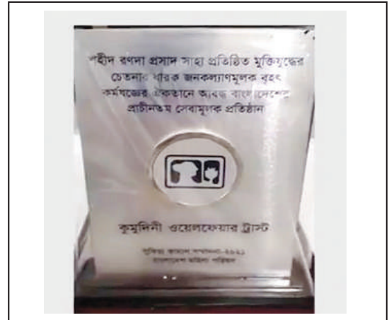
Replica of the Award.