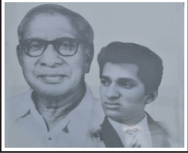
Shaheed Ranada Prasad Shaha and his son Shaheed Bhabani Prasad Shaha.

১৯৭১ সালের ৭ই মে এই দিনে পাকিস্তান বাহিনী ও স্বাধীনতা বিরোধী সাম্প্রদায়িক দুর্বৃত্তরা মির্জাপুরের শতাধিক নিরীহ গ্রামবাসীকে হত্যা করার পর সেদিনই রাতের আঁধারে অসহায় মানুষের প্রাণের মানুষ দানবীর রণদা প্রসাদ সাহা ও তাঁর পুত্র ভবানী প্রসাদ সাহাকে তাঁদের নারায়ণগঞ্জের কর্মস্থল থেকে অপহরণ করে নিয়ে হত্যা করে। এই শোকাবহ দিনটি স্মরণে কুমুদিনী পরিবার ৭ই মে চলমান মহামারির কারণে অনলাইনে এক সংক্ষিপ্ত শোক সভায় আয়োজন করে।