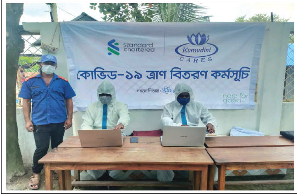
Covid-19 relief distribution programme in Narayanganj: A joint venture of Kumudini and Standard Chartered Bank.

করোনার দ্বিতীয় ঢেউয়ের তাণ্ডে বিশ্বের অন্যান্য দেশের মতো আমাদের দেশের মানুষও দিশেহারা। কোভিড-১৯ মহামারি রূপে সমগ্র বিশ্বকে গ্রাস করে চলেছে। বাংলাদেশও এর ব্যতিক্রম নয়। ফলে মানুষের জীবন ভয়ানকভাবে বিপর্যস্ত। সংক্রমণ বাড়ার সঙ্গে তাল মিলিয়ে বাড়ছে মৃত্যু। লক ডাউন, চলাচল কড়াকড়ি, স্বাস্থ্যবিধি মেনে চলার সরকারি কঠোর নির্দেশ সত্ত্বেও করোনার বিস্তার রোধ করা কঠিন হয়ে পড়ছে। এমন পরিস্থিতিতে মানুষের জীবন ও জীবিকা হুমকির মুখে পড়েছে। বাড়ছে বেকার ও দুঃস্থ মানুষের সংখ্যা। মানুষের এই অসহায়ত্ব লাঘবের উদ্দেশ্যে কুমুদিনী ওয়েলফেয়ার ট্রাস্ট তার অতীত ঐতিহ্য ও অভিজ্ঞতাকে কাজে লাগিয়ে দুঃস্থ ও দরিদ্র মানুষের সেবায় সম্পৃক্ত হয়েছে। বিপন্ন মানুষের মাঝে ত্রাণ বিতরণে এগিয়ে এসেছে। এই কাজে কুমুদিনী ওয়েলফেয়ার ট্রাস্টের সহযোগী হয়েছে স্ট্যান্ডার্ড চার্টার্ড ব্যাংক।