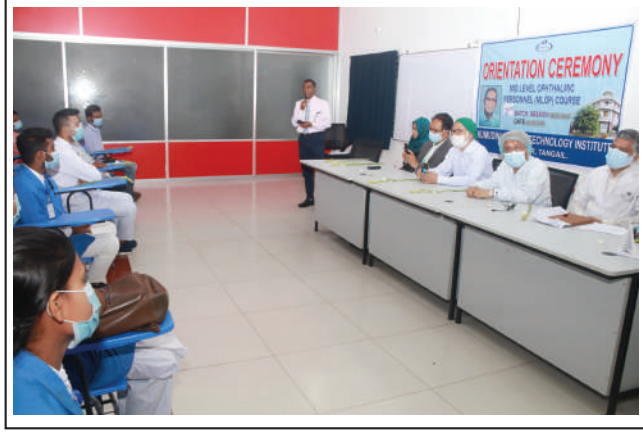
Orientation Ceremony of the 21st batch of MBBS first year students held online and offline on 2 August 2021 at B P Pati Hall of Kumudini Women's Medical College.

উল্লেখ্য, নবীনবরণের দিন থেকেই কলেজে নির্ধারিত সিলেবাস অনুসারে প্রথমবর্ষ এমবিবিএস এর ক্লাস শুরু হয়। ●