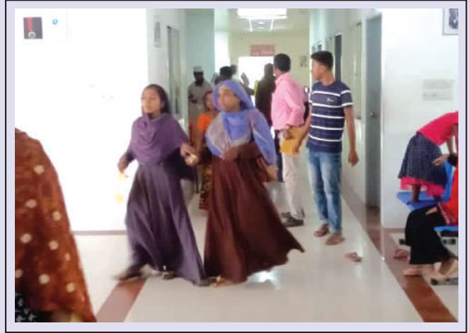
Out Patient Department (OPD).