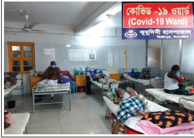
Corona patients undergoing treatment at Covid-19 Ward of Kumudini Hospital.

করোনা আক্রান্ত রোগীদের বিনামূল্যে চিকিৎসাসেবা দিয়ে যাচ্ছে দানবীর রণদা প্রসাদ সাহা প্রতিষ্ঠিত মির্জাপুরের কুমুদিনী হাসপাতাল। এ উদ্দেশ্যে হাসপাতাল কর্তৃপক্ষ চালু করেছে একটি করোনা ইউনিট। অক্সিজেন সরবরাহসহ করোনা রোগীদের চিকিৎসা ব্যয় হাসপাতাল কর্তৃপক্ষই বহন করে থাকে। হাসপাতালের ডাক্তার-সিস্টারগণ দিনরাত পরিশ্রম করে কোভিড আক্রান্তদের সেবা দিয়ে যাচ্ছেন। কেবলমাত্র করোনা রোগীদের চিকিৎসাসেবা দানে সর্বক্ষণ নিয়োজিত থাকেন ৪৮ জন নার্স এবং ৬ জন সিনিয়র ও জুনিয়র ডাক্তার।