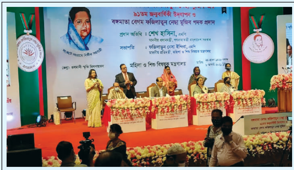
Bangamata Begum Fazilatun Nesa Mujib Padak-2021 recipients and their representatives at Osmani Memorial Auditorium, Dhaka.