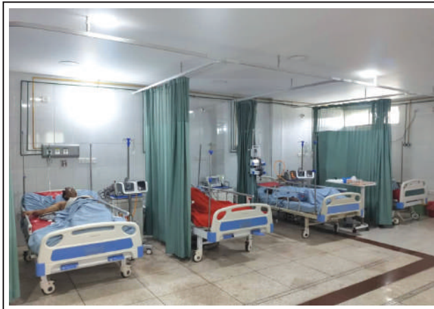
Patients with symptoms of Corona at Isolation Unit of the hospital.

গত জুলাই ও আগস্ট এই দুই মাসে ৬০০ এর অধিক রোগী কুমুদিনী হাসপাতালে আইসোলেশন ও কোভিড ওয়ার্ডে ভর্তি থেকে চিকিৎসা নিয়েছেন এবং বহির্বিভাগে ২০০০ হাজারের অধিক রোগী চিকিৎসকের পরামর্শ গ্রহণ করেছেন। চলমান করোনা মহামারি পরিস্থিতিতে সুবিধা বঞ্চিত রোগীরা এই হাসপাতাল থেকে নিখরচায় করোনা চিকিৎসাসেবা গ্রহণ করে সুস্থ হয়ে বাড়ি ফিরে যাচ্ছেন।