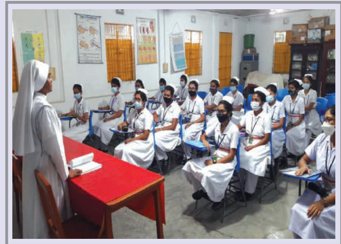
Students of Kumudini Nursing College attending Midwifery class.