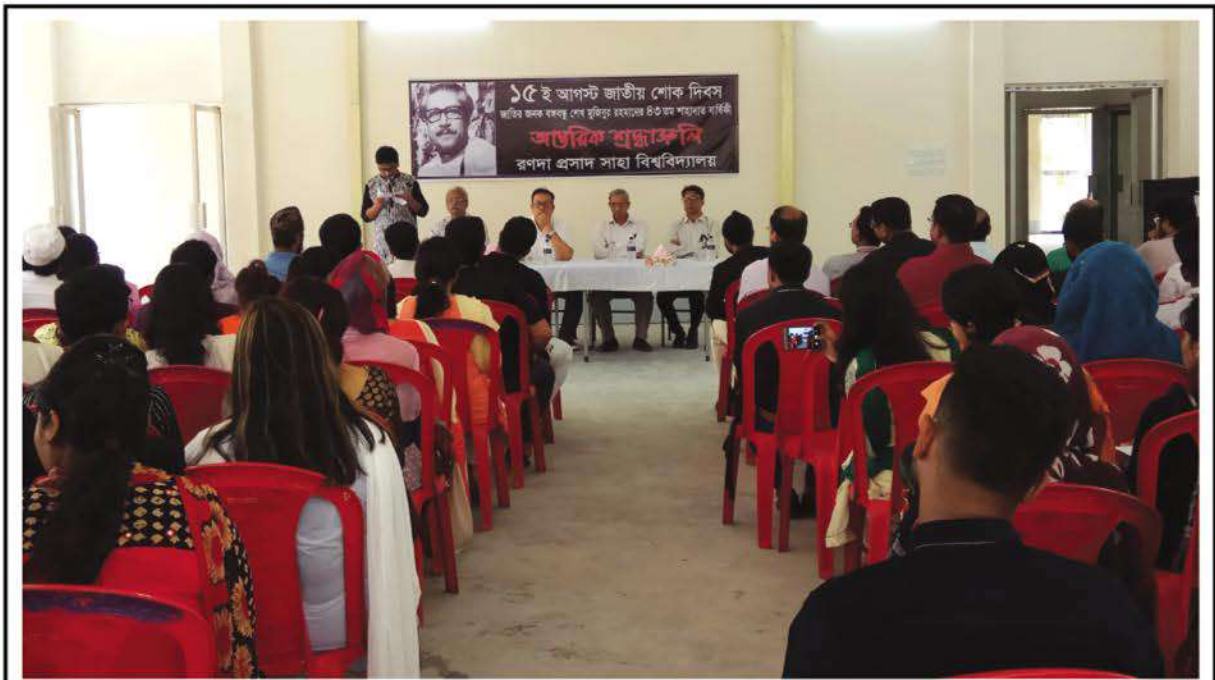
National Mourning Day commemorating 15th August observed at Ranada Prasad Shaha University (RPSU)