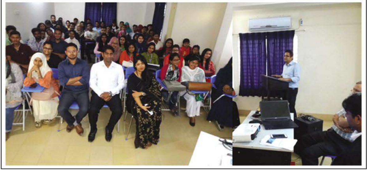
Seminar : From Classroom to Profession.