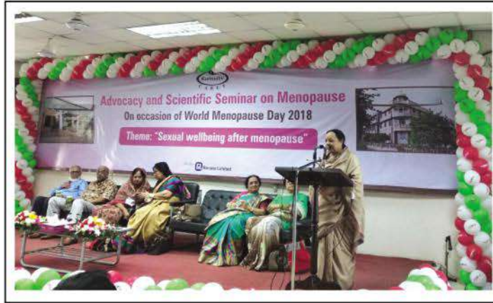
A Seminar at BP Pati Hall of KWMC arranged by Bangladesh Menopause Society.