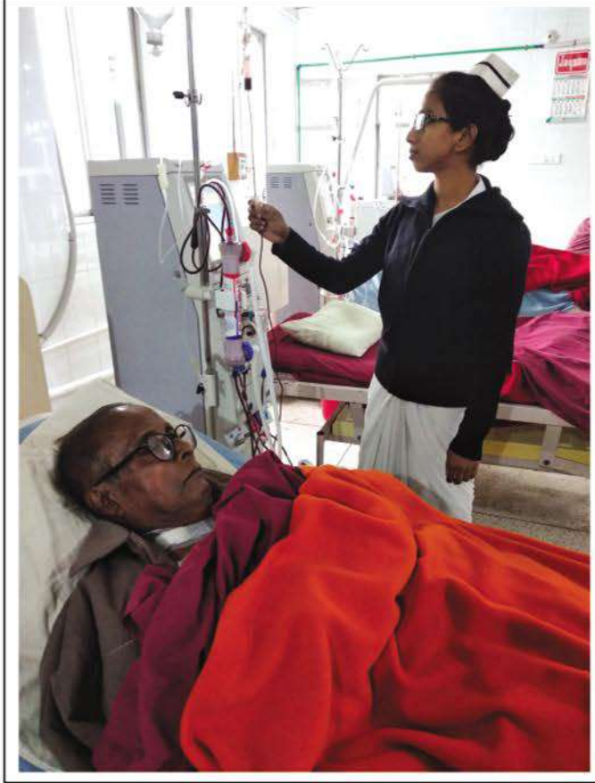
A patient with kidney ailment undergoing dialysis at Kumudini Hospital.