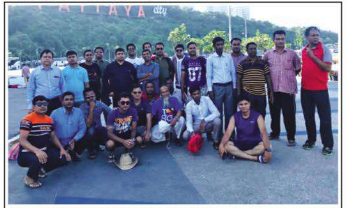
Group photo of KPL officers who visited Thailand.

Twenty eight officers of Kumudini Pharma Ltd (KPL) went on a visit to Thailand November last. The visit was financed by KPL. This was an incentive to the officers on a commendable service to the organization. Most of those who went abroad were field officers of the Sales Department. There were two officers from the factory as well. The five day trip included visit to Bangkok and Patya. The team left for Thailand on 23 November and returned home on 29 November. ●