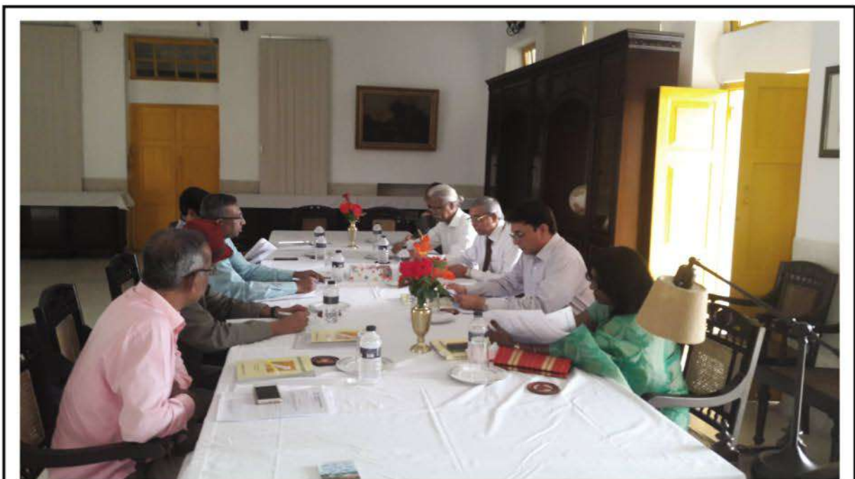
Participant members in the last meeting of RPSU Syndicate held on 7 November at Kumudini Complex, Mirzapur.