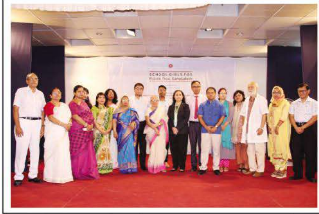
Participants of Fistula Awareness Seminar arranged at Bharateswari Homes by Fistula Centre of BSMMU.

The seminar divided in two parts was conducted from 9 to 11 in the morning. An introductory discussion took place where girls from class IX to XII of Bharateswari