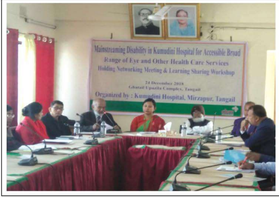
'Networking Meeting & Learning Sharing Workshop' at Ghatail organized by Kumudini Hospital.