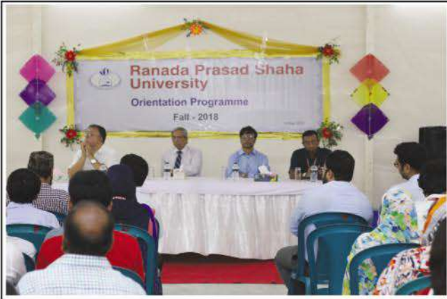
Fresher's reception of the 14th batch.