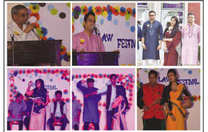
Law Festival in Pictures.