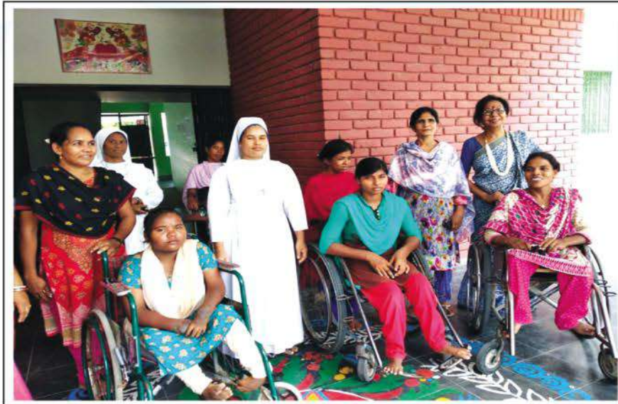
The visiting team of Kumudini with the physically challenged students of 'Snehanir' at Baganpara in Rajshahi.

The visit enlightened the team with the knowledge that the challenged are not a burden for the family or society. If the state and the society are compassionate the challenged can be an asset. ●