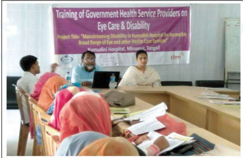
Training of Govt. Health Service Providers on Eye Care & Disability.

গত ২৬ ও ২৭ জুন সখীপুর উপজেলায় গভর্নমেন্ট হেল্থ সার্ভিস প্রভাইডারদের জন্য দু’দিন ব্যাপী প্রশিক্ষণের আয়োজন করা হয়। এতে অন্ধত্ব দূরীকরণসহ প্রতিবন্ধীতার অন্যান্য বিষয় নিয়ে আলোচনা হয়। এই কার্যক্রমে ৫০ জন প্রশিক্ষণার্থী উপস্থিত ছিলেন।