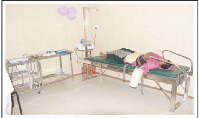
Physiotherapy Dept. of the hospital has been modernized recently with new equipment.