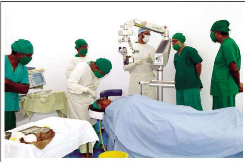
Cataract patient is being operated upon using modern Phaco Surgery machine.