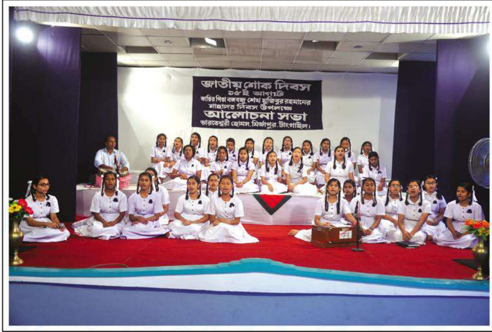
Students of Bharateswari Homes rendering songs to mark the National Mourning Day.

কুমুদিনী ওয়েলফেয়ার ট্রাস্ট গত ১৫ আগস্ট জাতির জনক বঙ্গবন্ধু শেখ মুজিবুর রহমানের ৪৩তম শাহাদাৎ বার্ষিকী ও জাতীয় শোক দিবসটি গভীর শ্রদ্ধা নিবেদনের মাধ্যমে উদ্‌যাপন করে। দিবসের কর্মসূচির মধ্যে ছিল ট্রাস্টের মির্জাপুর কমপ্লেক্সে প্রত্যুষে বঙ্গবন্ধুর প্রতিকৃতিতে পুষ্পার্ঘ্য অর্পণ, জাতীয় পতাকা ও শোকের প্রতীক হিসেবে কালো পতাকা উত্তোলন।