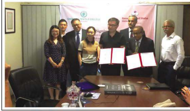
Signing of MoU between RPSU and Chengdu Textile College of China.

ফেশন ডিজাইনিংয়ে আগ্রহী তাদের জন্য নি:সন্দেহে এটি একটি সুখবর। উল্লেখ্য, আরপিএসইউ শীঘ্রই টেক্সটাইল ইঞ্জিনিয়ারিং ও ফেশন ডিজাইনিংয়ের ওপর কোর্স চালু করতে যাচ্ছে। ●