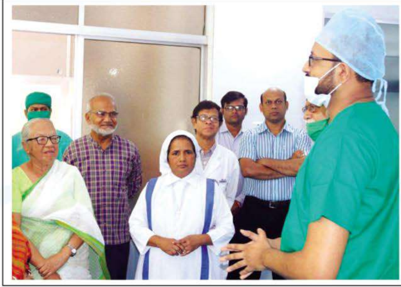
Phaco Surgeon is expressing his experience after successful operation.