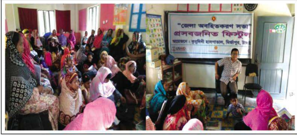
Fistula Awareness meeting at Kumudini Hospital

গত ২৭ মে ও ১৪ আগস্ট কুমুদিনী হাসপাতালের উদ্যোগে এনজেন্ডার হেলথ-এর প্রকল্প 'ফেস্টুলা কেয়ার প্রজেক্ট' এর আওতায় দু'টি অবহিতকরণ সভা অনুষ্ঠিত হয়। প্রথমটি অনুষ্ঠিত হয় টাংগাইলের সখীপুর ব্র্যাক অফিসে এবং দ্বিতীয়টি একই জেলার গোপালপুরে। সখীপুরের সভায় ৬০ জন এবং গোপালপুরের সভায় ৫৪ জন ব্র্যাকের স্বাস্থ্য সেবিকা উপস্থিত ছিলেন।