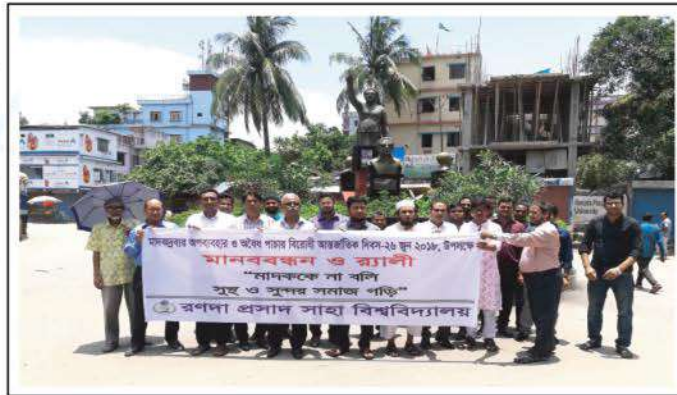
A rally against abuse and trafficking of drugs.

“মাদককে না বলি সুস্থ ও সুন্দর সমাজ গড়ি।”