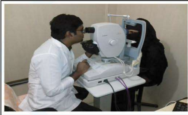
A cataract patient is being examined with modern computerized machine.