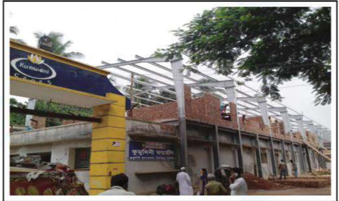
Renovation of Hospital outdoor is being done with addition of extra floor on top.