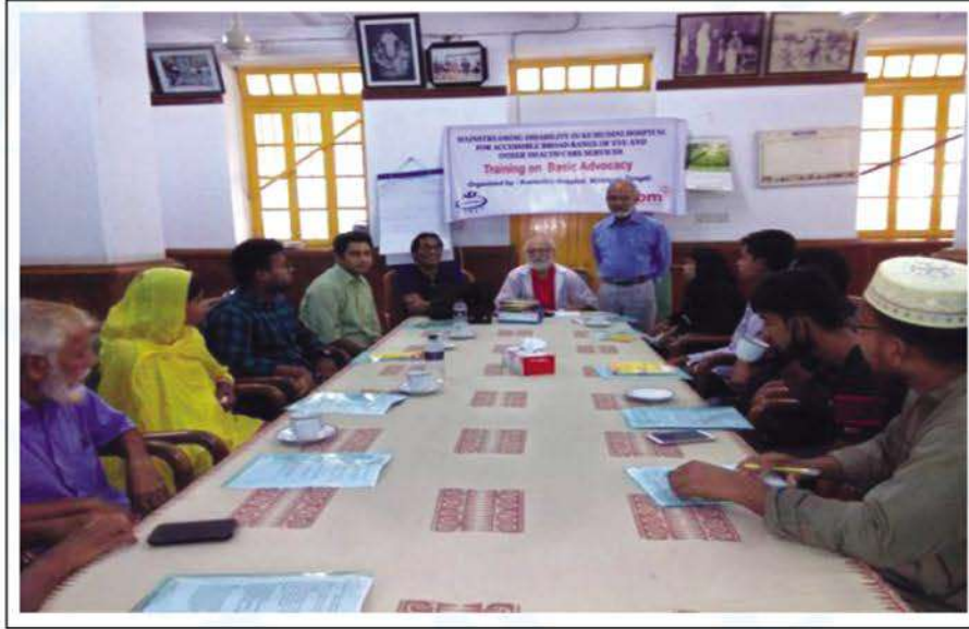
Training on Basic Advocacy.

Basic Advocacy training was conducted at the new library of Kumudini Hospital on 26 and 27 June. Discussions took place on what advocacy is and how could the disabled be included in the mainstream. The training was conducted by thematic expert of CDD Md Jahangir Alam. ●