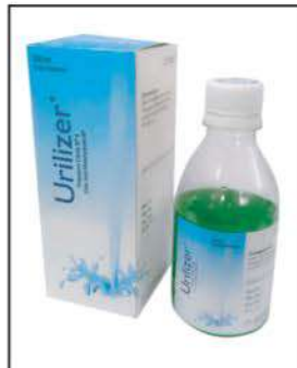
Urilizer Oral Solution