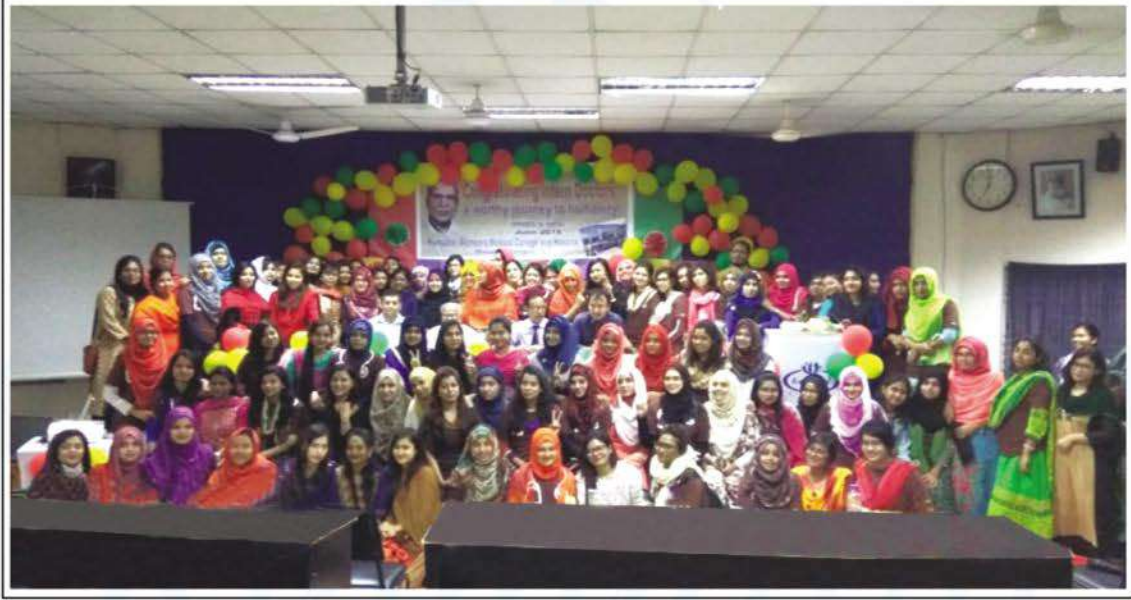
MBBS and BDS students of Kumudini Women's Medical College who completed their internship in 2018.

গত ২ জুন বিকেলে কলেজের বি পি পতি হলে কুমুদিনী উইমেন্স মেডিকেল কলেজ ও হাসপাতালের এমবিবিএস ও বিডিএস ডাক্তারদের 'ইন্টার্নশীপ সমাপনী' অনুষ্ঠান সম্পন্ন হয়। এই উপলক্ষে বি পি পতি হলটি আকর্ষণীয় করে সাজানো হয়েছিল। অনুষ্ঠানে কলেজের অধ্যাপকবৃন্দ ও হাসপাতালের ডাক্তারগণ সহ ইন্টার্ন ডাক্তাররা উপস্থিত ছিলেন।