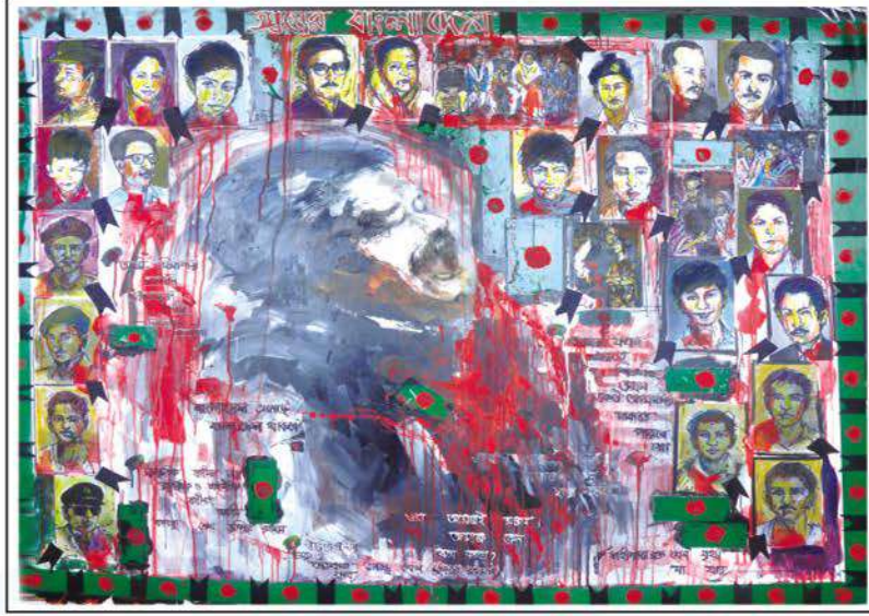
Martyrs of 15th August– all from Bangabandhu family. Pictures drawn by the students of Bharateswari Homes.