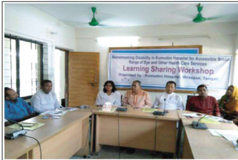
Kumudini Hospital organizes this type of Learning Sharing Workshop at different places in support with cbm.