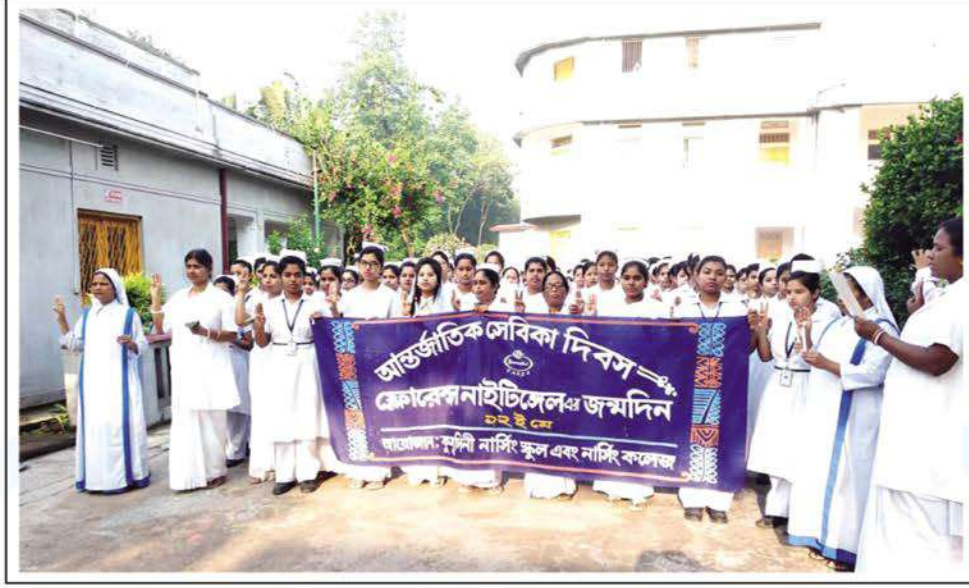
Teachers and students of the Kumudini Nursing School & College going around hospital campus with lighted candles in their hands on International Nurses Day.

কুমুদিনী নার্সিং স্কুল এন্ড কলেজের ছাত্রী-শিক্ষকবৃন্দের উদ্যোগে গত ১২ মে কুমুদিনী হাসপাতালে উদযাপিত হয়েছে আন্তর্জাতিক সেবিকা দিবস। আধুনিক নার্সিং সেবার অগ্রদূত ফ্লোরেন্স নাইটিঙ্গেলের জন্ম দিন উপলক্ষে প্রতি বছর এই দিবসটি আন্তর্জাতিক সেবিকা দিবস হিসেবে পালিত হয়। এবার ছিল তাঁর ১৯৮তম জন্মজয়ন্তী।