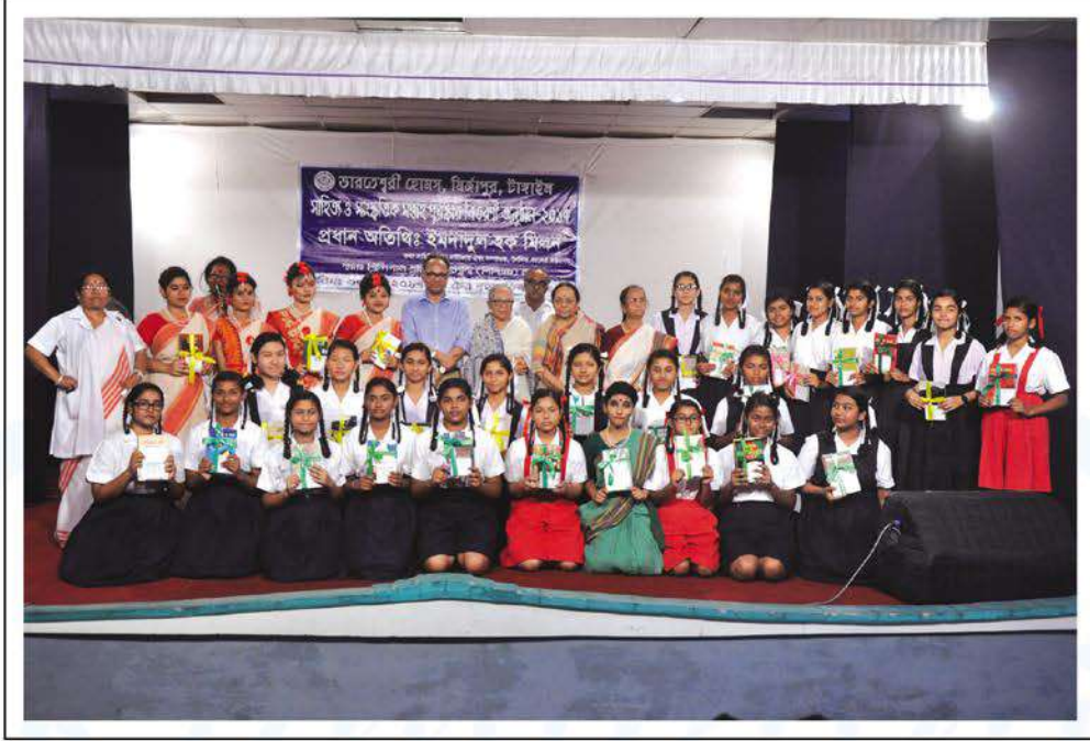
Prize winning students in the Education and Cultural Week programme with the chief guest Mr Emdadul Haq Milon.