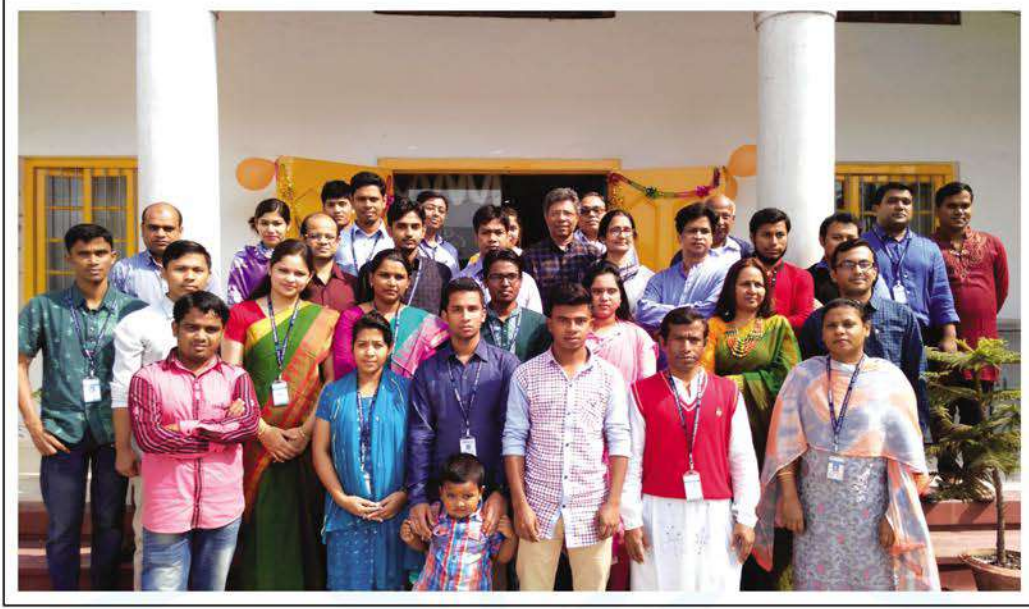
Officers and employees of CHRF Centre at Kumudini Hospital.

সম্প্রতি কুমুদিনী হাসপাতালে স্থাপিত অত্যাধুনিক রোগ নির্ণয় ও গবেষণাকেন্দ্র ‘চাইল্ড হেলথ রিসার্চ ফাউন্ডেশন (সিএইচআরএফ)’-এর পঞ্চম প্রতিষ্ঠাবার্ষিকী পালিত হয়েছে।