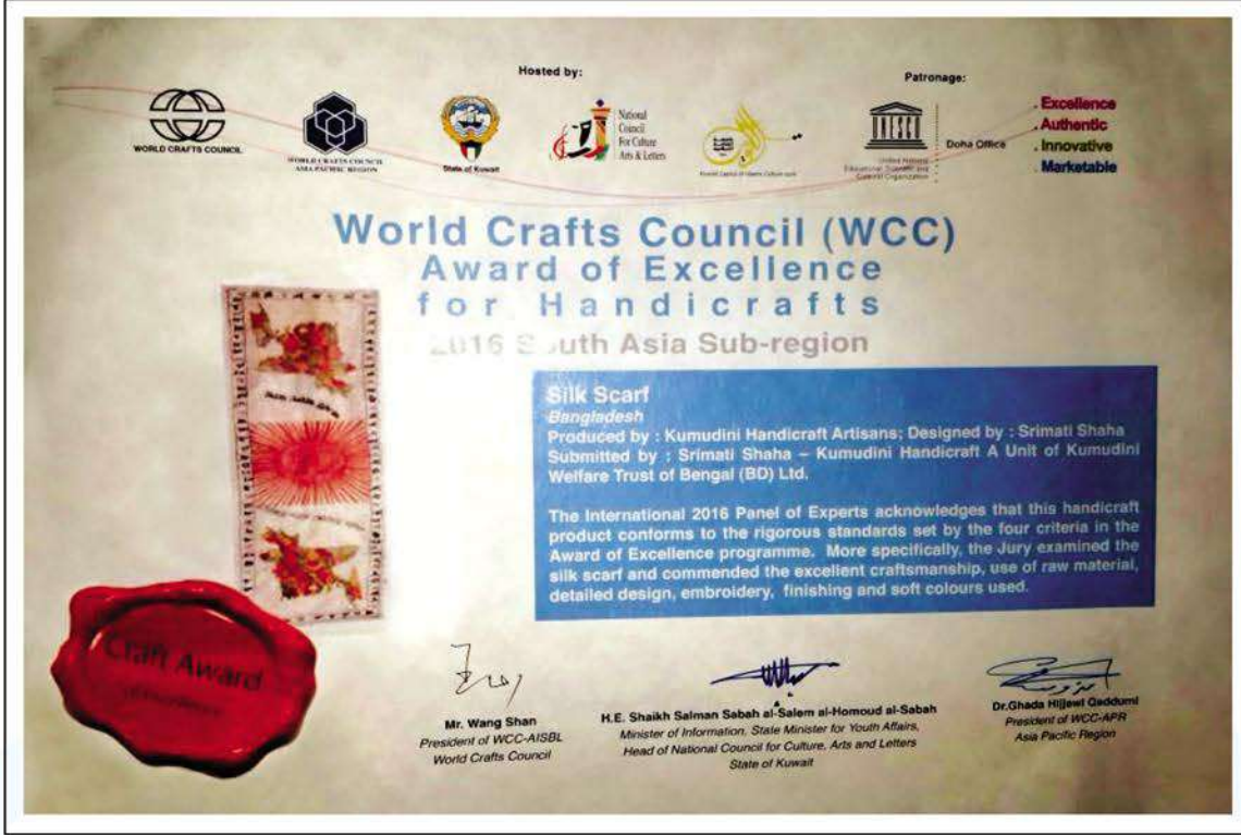
'WWC Award of Excellence' for Kumudini Handicrafts.

কুমুদিনী হ্যান্ডিক্র্যাফট এর তৈরি পণ্য এশীয় প্রশান্ত মহাসাগরীয় অঞ্চলের ওয়ার্ল্ড ক্র্যাফট কাউন্সিল কর্তৃক আয়োজিত ২০১৬ সালের অ্যাওয়ার্ড প্রোগ্রামে WCC Award of Excellence for 2016 অর্জন করেছে।