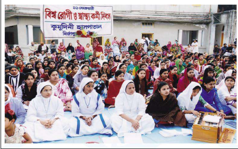
Nurses and health workers rendering prayer songs.

কুমুদিনী হাসপাতালে গত ১১ ফেব্রুয়ারি পালিত হয়েছে বিশ্ব রোগী ও স্বাস্থ্যকর্মী দিবস। এ উপলক্ষে হাসপাতালের বিভিন্ন ওয়ার্ড প্রাঙ্গণ দৃষ্টিনন্দন করে সাজানো হয়। সেবক-সেবিকা ভাইবোনেরা হাসপাতালে চিকিৎসাধীন রোগীদের নিকট দিবসটির তাৎপর্য ব্যাখ্যা করেন।