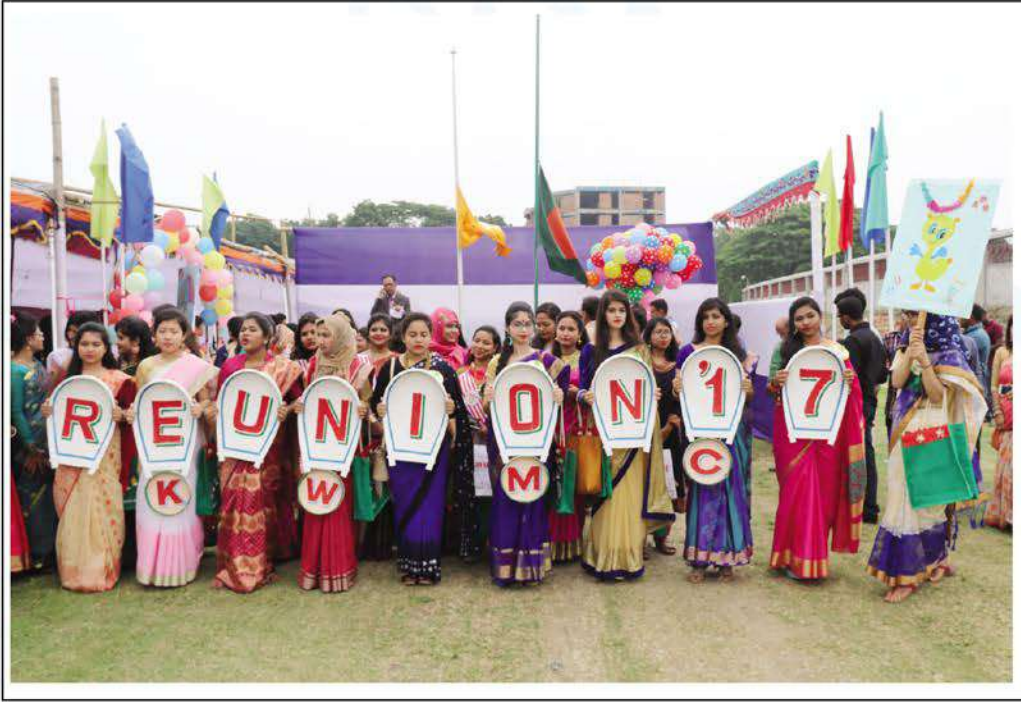
'KWMC Reunion-2017': a grand meet of the former students of Kumudini Women's Medical College held in the college premises.

A colourful souvenir was also brought out on the