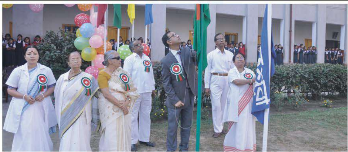
Inauguration of annual sports of Bharateswari Homes.