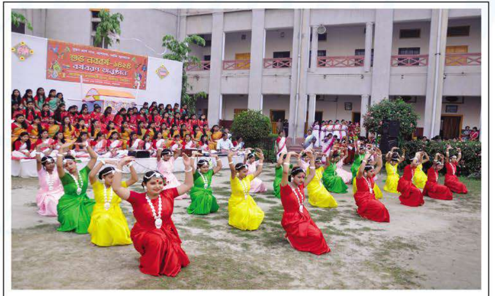
Students of Bharateswari Homes performing dance in a programme on Bangla New Year's day.

The year 1423 was bid farewell on the day before i.e. 13 April. The students organized a dance drama on the occasion. As in the previous years the students brought out a wall magazine. ●