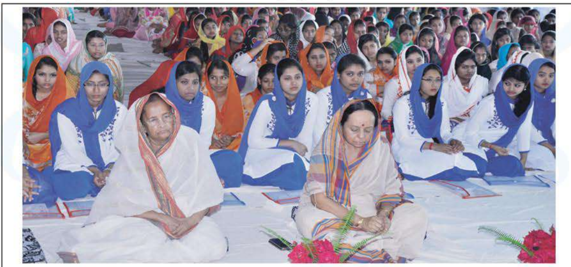
Annual Milad Mahfil at Bharateswari Homes.