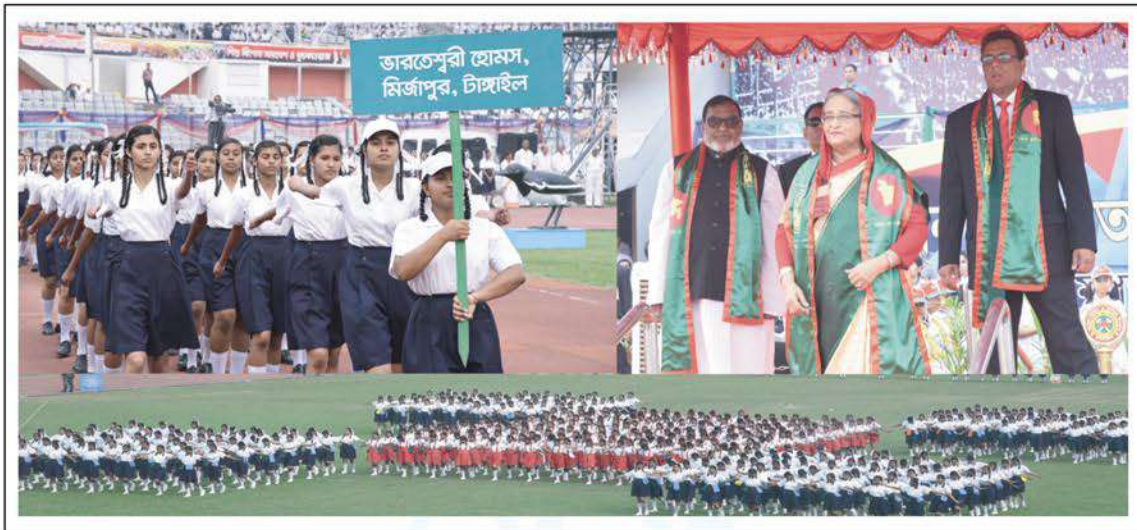
March past and physical display by the students of Bharateswari Homes at Bangabandhu National Stadium on Independence and National Day.