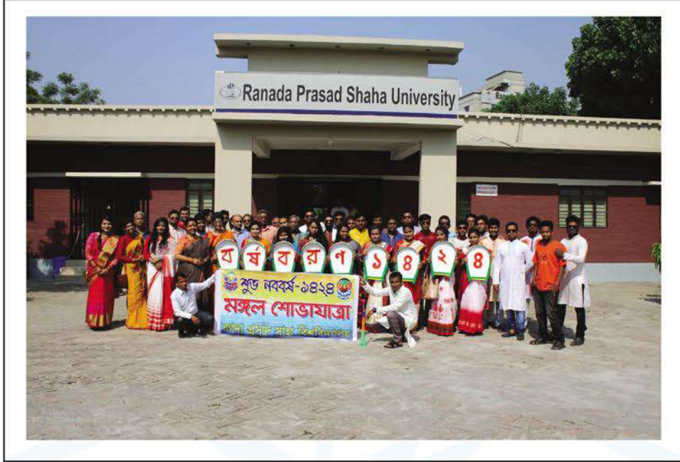
Celebration of Bangla New Year : 1424 at RPSU campus.

বিপুল উৎসাহ উদ্দীপনার মধ্য দিয়ে নারায়ণগঞ্জে রণদা প্রসাদ সাহা বিশ্ববিদ্যালয়ের ছাত্রছাত্রী-শিক্ষক-কর্মকর্তা-কর্মচারীবৃন্দ বাংলা ১৪২৪ সালকে নানা অনুষ্ঠানের মধ্য দিয়ে স্বাগত জানান।