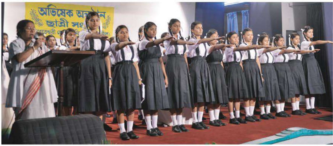
Oath taking ceremony of members of the new Students Union of Bharateswari Homes.