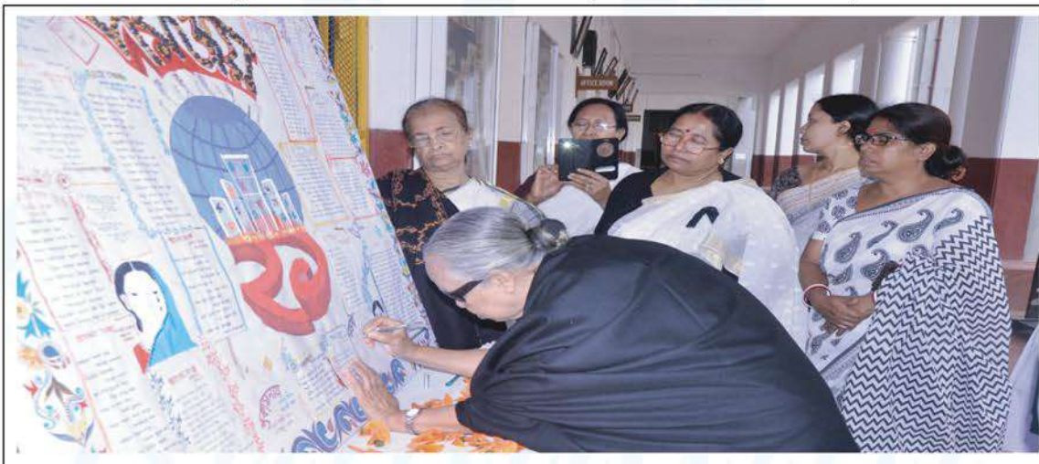
Martyr Day and International Mother Language Day observed at Bharateswari Homes.