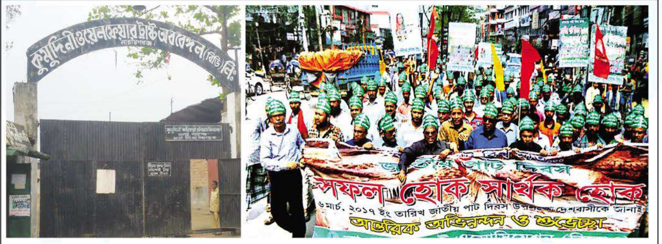
A rally at Narayanganj on 'National Jute Day : 2017' brought out by Bangladesh Jute Association and employees of Kumuduni's Jute Division.

On 9 March Prime Minister Sheikh Hasina inaugurated the jute products fair at the Krishibid Institution located at Khamarbari in Dhaka on the occasion of 'National Jute Day: 2017.' In addition special supplements were brought out by the national dailies on behalf of the concerned ministry. ●