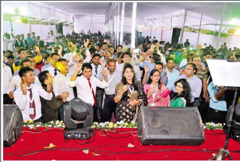
Marketing Personnel are rejoicing at the 2 nd phase of the conference.

প্রীতিভোজ শেষে কনফারেন্সের দ্বিতীয় পর্বের বিনোদনমূলক অনুষ্ঠান শুরু হয় বিকেল ৩টায়। এতে ছিল র্যাফেল ড্র, সাংস্কৃতিক অনুষ্ঠান, পরস্পরের মধ্যে ভাব বিনিময় ইত্যাদি। অনুষ্ঠানের সমাপ্তি ঘটে সন্ধ্যা সাড়ে সাতটায়। ●