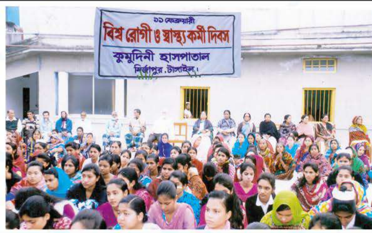
Health workers of the Kumudini Hospital observed the day with special prayers wishing good health for all the patients.