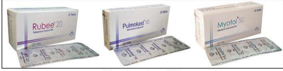
Three new products of KPL

কুমুদিনী ফার্মা লিমিটেড (কেপিএল) সম্প্রতি নিজস্ব কারখানায় উৎপাদিত তিনটি নতুন ওষুধ বাজারজাত করেছে। ট্যাবলেট আকৃতির এ ওষুধগুলো হচ্ছে রুবি-২০, পালমোকাস্ট-১০ এবং মায়োটল-৫০।