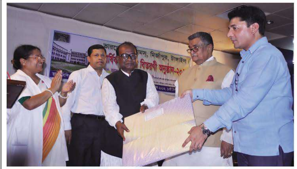
Khandakar Mosharrarf Hossain, Minister for LGRD & Co-operative, is being presented a 'Nakshi Kantha Wall Mat' - a product of Kumudini Handicraft during his visit to Kumudini Complex at Mirzapur.

গত ২৮ এপ্রিল ভারতেশ্বরী হোমসের পিপিএম হলে অনুষ্ঠিত ২০১৫ সালের বার্ষিক পুরস্কার বিতরণী অনুষ্ঠানে এ বিদ্যায়তনের মেধাবী ছাত্রীদের মধ্যে পুরস্কার বিতরণ করেন অনুষ্ঠানের প্রধান অতিথি স্থানীয় সরকার, পল্লী উন্নয়ন ও সমবায় মন্ত্রী খন্দকার মোশাররফ হোসেন, এমপি।