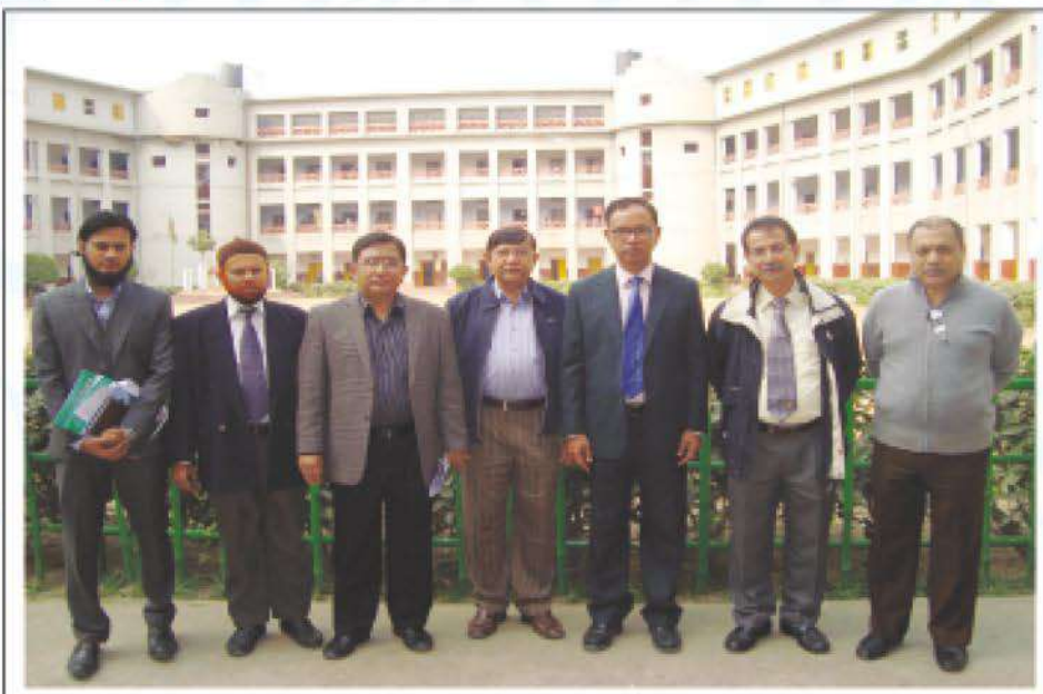
The delegation from JIMCH at the premises of Bharateswari Homes with the doctors of KWMCH while visiting Kumudini Complex at Mirzapur.

Earlier an advance party consisting of five members from JIMCH visited Kumudini campus on 18 January 2016. ●