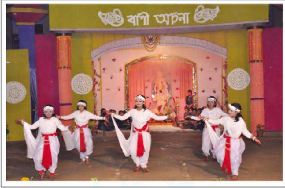
Students performing dance at the Puja Mondop.

করে এবং পরে হোমসের সবুজ প্রাঙ্গণে স্থাপিত অস্থায়ী মণ্ডপের বেদিতে প্রতিমা স্থাপন করে। শোভাযাত্রা ও দেবী বন্দনায় অংশ নেয় ভারতেশ্বরী হোমস, কুমুদিনী নার্সিং স্কুল ও কলেজের ছাত্রীবৃন্দ। শিক্ষার্থীরা দেবীর চরণে পুষ্পাঞ্জলি নিবেদন করে দেবীর আশীর্বাদ গ্রহণ করে। পূজা শেষে তাদের মধ্যে প্রসাদ বিতরণ করা হয়। সন্ধ্যায় ছাত্রীদের অংশগ্রহণে মণ্ডপে অনুষ্ঠিত হয় বিশেষ আরতি অনুষ্ঠান।