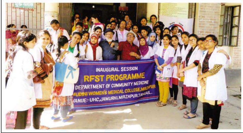
As part of their Study Tour, KWMC students visited Upazila Health Complex at Jamurki near Mirzapur.

সম্প্রতি কুমুদিনী উইমেন্স মেডিকেল কলেজের ৩য় ও ৪র্থ বর্ষের এমবিবিএস ছাত্রীরা কমিউনিটি মেডিসিন বিষয়ের আওতায় ঢাকা বিশ্ববিদ্যালয়ের কারিকুলাম ভুক্ত RFST, Day Visit ও Study Tour কার্যক্রম সম্পন্ন করেছেন।