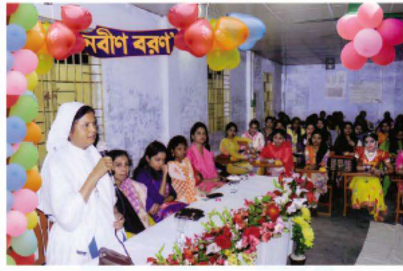
Freshers' reception programme of 2015-16 Batch of Kumudini Nursing School & College.

গত ১৭ ফেব্রুয়ারি কুমুদিনী নার্সিং স্কুল এন্ড কলেজের ২০১৫-১৬ ব্যাচের ছাত্রীদের নবীনবরণ অনুষ্ঠিত হয়। এদের মধ্যে 'ডিপ্লোমা ইন সাইন্স এন্ড মিজওয়াইফারি' কোর্সের ৬০ জন এবং 'বিএসসি ইন নার্সিং' কোর্সের ৩৮ জন ছাত্রী ছিলেন। নবীন ছাত্রীদের স্কুল-চন্দন-রাখী দিয়ে বরণ করা হয়। এরপর আয়োজন করা হয় একটি মনোজ্ঞ সাংস্কৃতিক অনুষ্ঠানের। ●