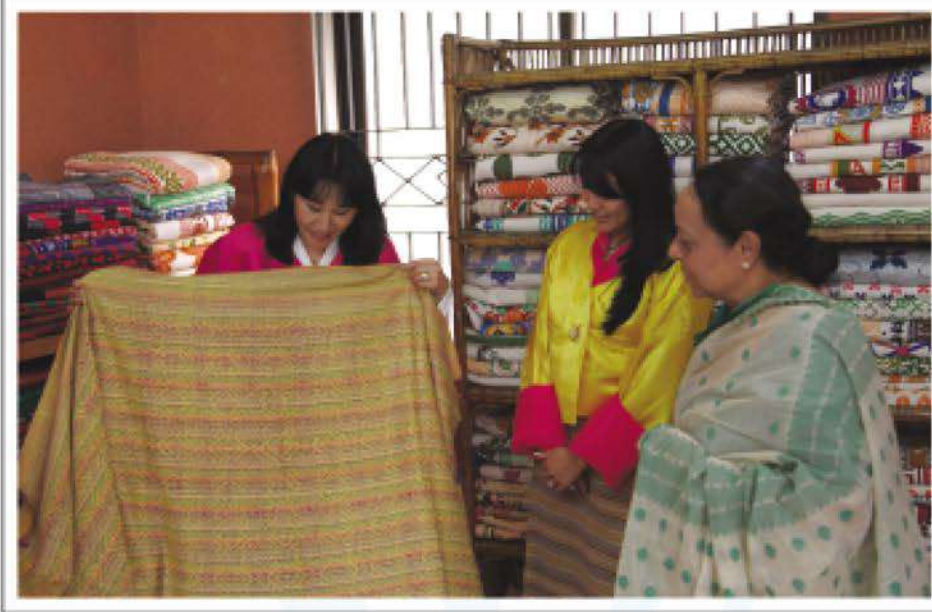
The Queen Mother of Bhutan Shering Pem Wangchuk and Princess Chimi Wangchuk admiring colourful products of Kumudini Handicrafts while visiting its Gulshan Sales and Display Centre.