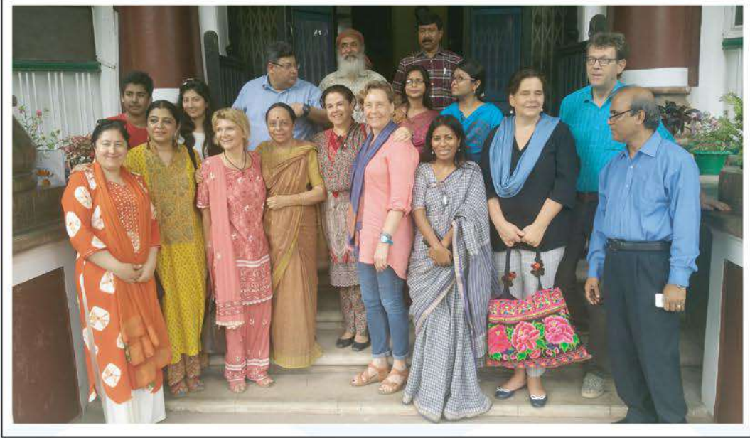
The members of delegation of ambassadors and diplomats from some western countries who visited Kumudini Complex at Narayanganj.