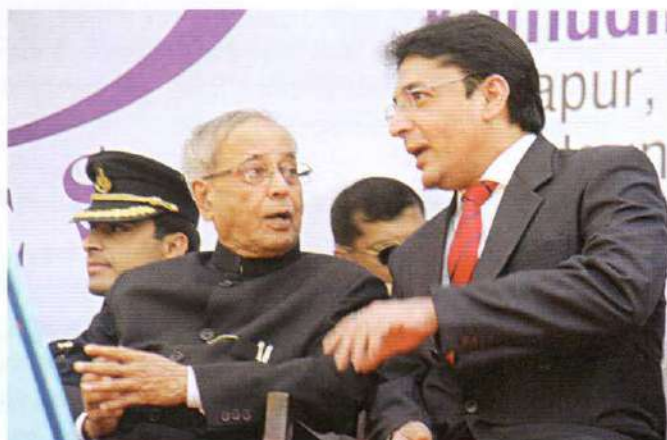
The President being enchanted with beauty of the display expresses his deep feelings to the MD of KWT