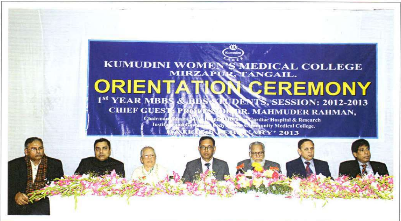
The Orientation Ceremony of the first year MBBS & BDS students of Kumudini Women's Medical College for the session: 2012-2013