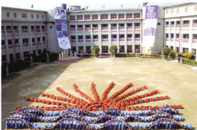
Rising Sun - a marvellous physical display by the Homes' students