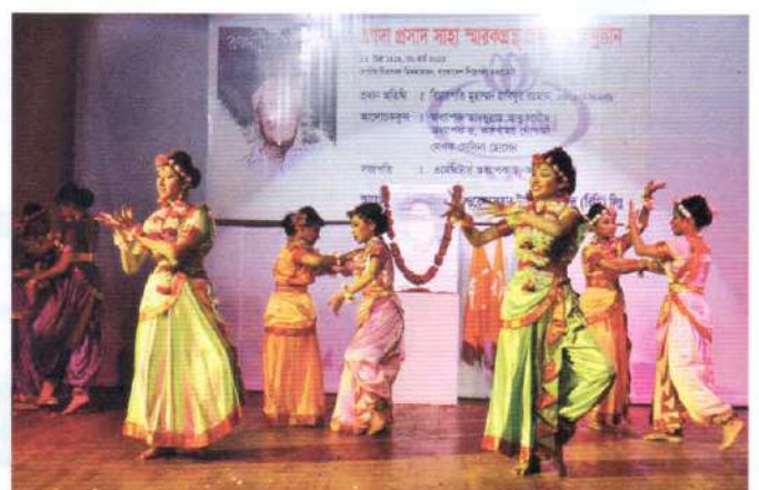
Students of Homes participating in the second session of the ceremony