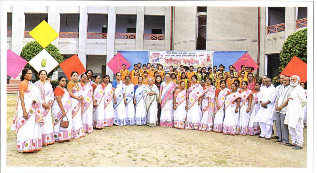
Bangla New Year's Celebration

Bengali New Year was celebrated at Bharateswari Homes on the 1st of Boishak. The students welcomed the new year with programmes of dance, song and recitation. As a part of the programme they went round the Kumudini Complex with a colorful rally. The students of Homes and Nursing School & College took part. On this occasion a hand written Bangla wall magazine named 'Ushasi' meaning the glowing light of dawn was also brought out. At the end of the function traditional Bengali food was served.