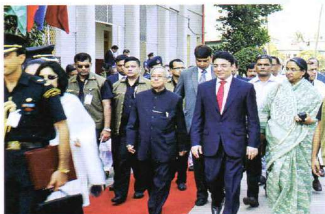
Advancing towards Kumudini Hospital