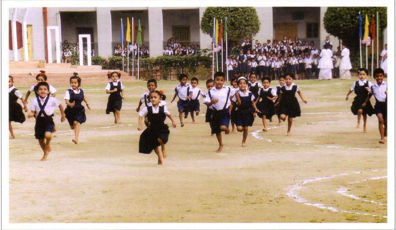
An enthusiastic race of the minor children with a view to reaching the goal