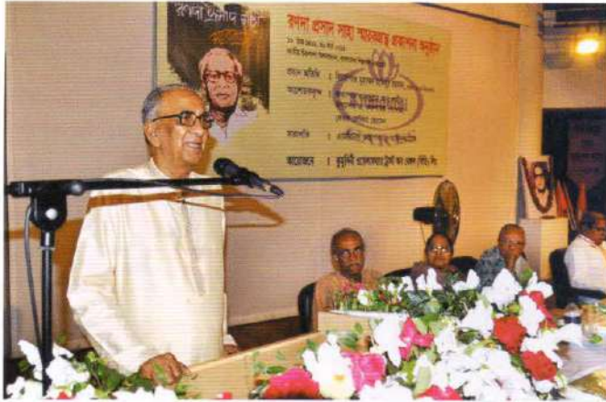
Justice Muhammad Habibur Rahman speaking as the Chief Guest