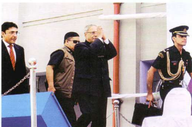
Exchange of good wishes with the audience