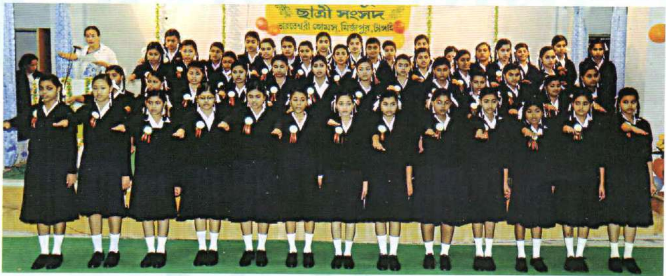
Oath taking ceremony of Student Union at Bharateswari Homes on 25 January, 2013

On the occasion the national flag was hoisted at the main gate of Kumudini Complex. Patients at the hospital and all other at different institutions of Kumudini were given improved diet.