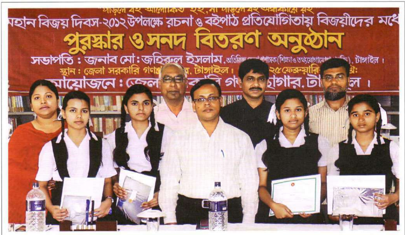
Students of Bharateswari Homes with prizes in an Essay and Book Reading Competition