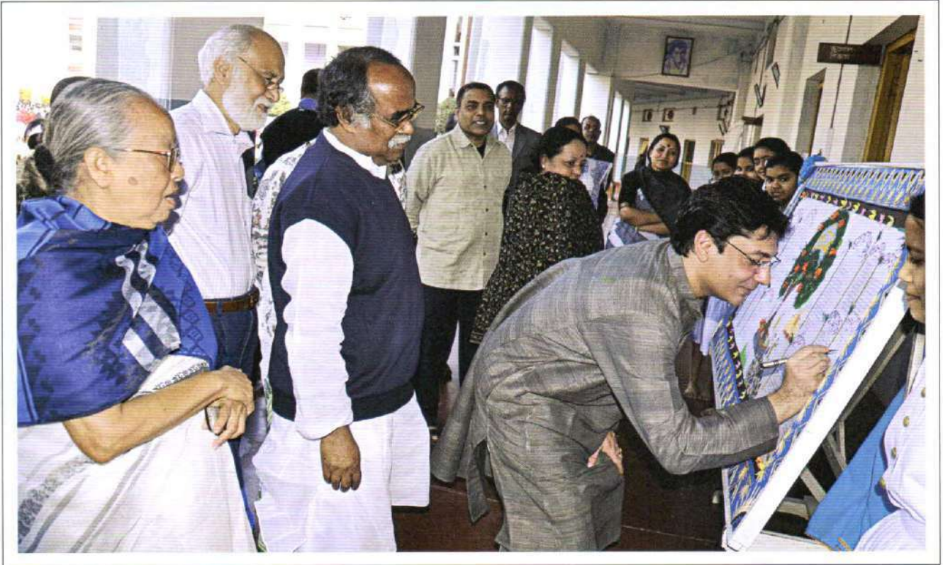
The MD of KWT is participating in the 'Letters to the Martyrs' programme launched by Bharateswari Homes in observance of International Mother Language Day and Shaheed Day.

ভাষার প্রতি ভালোবাসা, ভাষা শহীদদের প্রতি শ্রদ্ধা নিবেদন আর ৭১-এর মানবতা বিরোধী অপরাধের সর্বোচ্চ শাস্তির দাবি জানিয়ে এবার কুমুদিনী ওয়েলফেয়ার ট্রাস্টের মির্জাপুর কুমুদিনী কমপ্লেক্সে ভারতেশ্বরী হোমসের সবুজ প্রাঙ্গণে অন্যরকম এক আবহে পালিত হল মহান শহীদ দিবস ও আন্তর্জাতিক মাতৃভাষা দিবস। বায়ান্নের অমর ভাষা শহীদদের প্রতি শ্রদ্ধা জানাতে গত ২১ ফেব্রুয়ারি বৃহস্পতিবার রাত ১২.১ মিনিটে ভারতেশ্বরী হোমস, কুমুদিনী নার্সিং স্কুল ও কলেজ এবং কুমুদিনী উইমেন্স মেডিক্যাল কলেজের ছাত্রীরা প্রভাত ফেরিতে