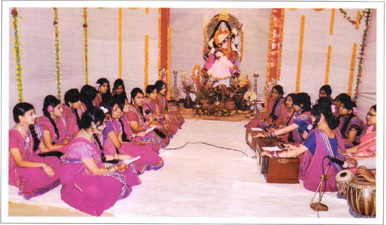
Students wearing traditional sarees performing devotional songs before the goddess Saraswati

শ্রীপঞ্চমীর প্রত্যুষে ছাত্রীরা নানা উপাচারে সরস্বতী প্রতিমাকে বরণ করে নেয়। প্রতি বছরের ন্যায় এবারও দশম শ্রেণির ছাত্রীরা শাড়ী পরে প্রতিমা বরণ করার পর কুমুদিনী কমপ্লেক্সে প্রদক্ষিণ করে। এরপর বিদ্যাদেবীর বেদীতে বই খাতা কলম রেখে ভক্তিচিন্তে দেবীর চরণে পুষ্পাঞ্জলি অর্পণ করে। উপস্থিত অন্যান্য হিন্দু ধর্মাবলম্বী ছাত্রীরাও তাদের অনুসরণ করে। দেবী অর্চনার পর হোমসের ছাত্রীরা কমপ্লেক্সের সকল প্রতিষ্ঠানের শিক্ষার্থী, শিক্ষক, চিকিৎসক, সেবিকা, কর্মকর্তা-কর্মচারীকে পূজার প্রসাদ দিয়ে আপ্যায়ন করে।