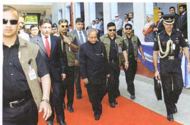
On arrival going directly to the Bharateswari Homes