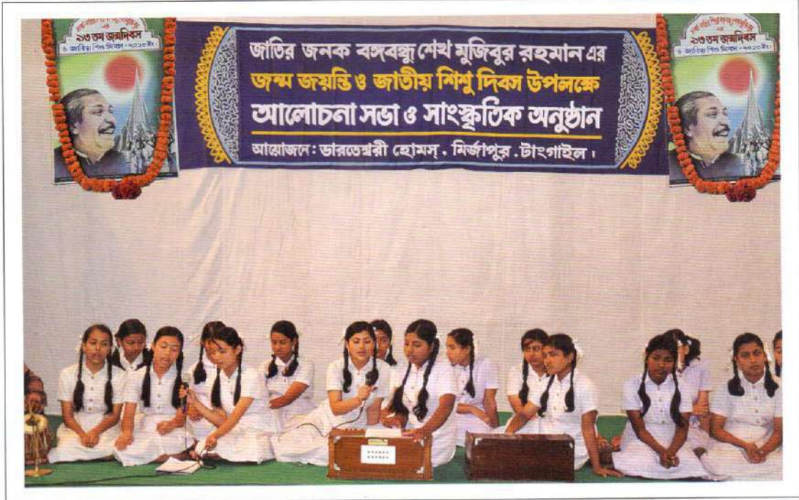
Students of Homes performing in the musical sketch Our Bangladesh

The 94th birth anniversary of the Father of the Nation Bangabandhu Sheikh Mujibur Rahman was celebrated at the PPM Hall of Bharateswari Homes on 17 January