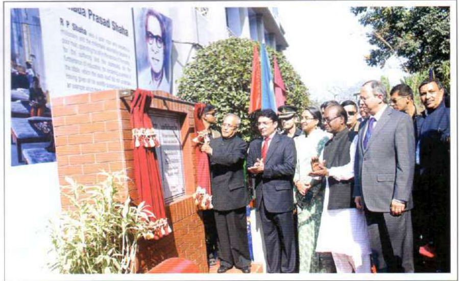
Shri Pranab Mukherjee, the Hon'ble President of India, laying foundation stone of the Combined Waste Management System at Kumudini Complex, Mirzapur

President of India Shri Pranab Mukherjee Visits Kumudini Complex