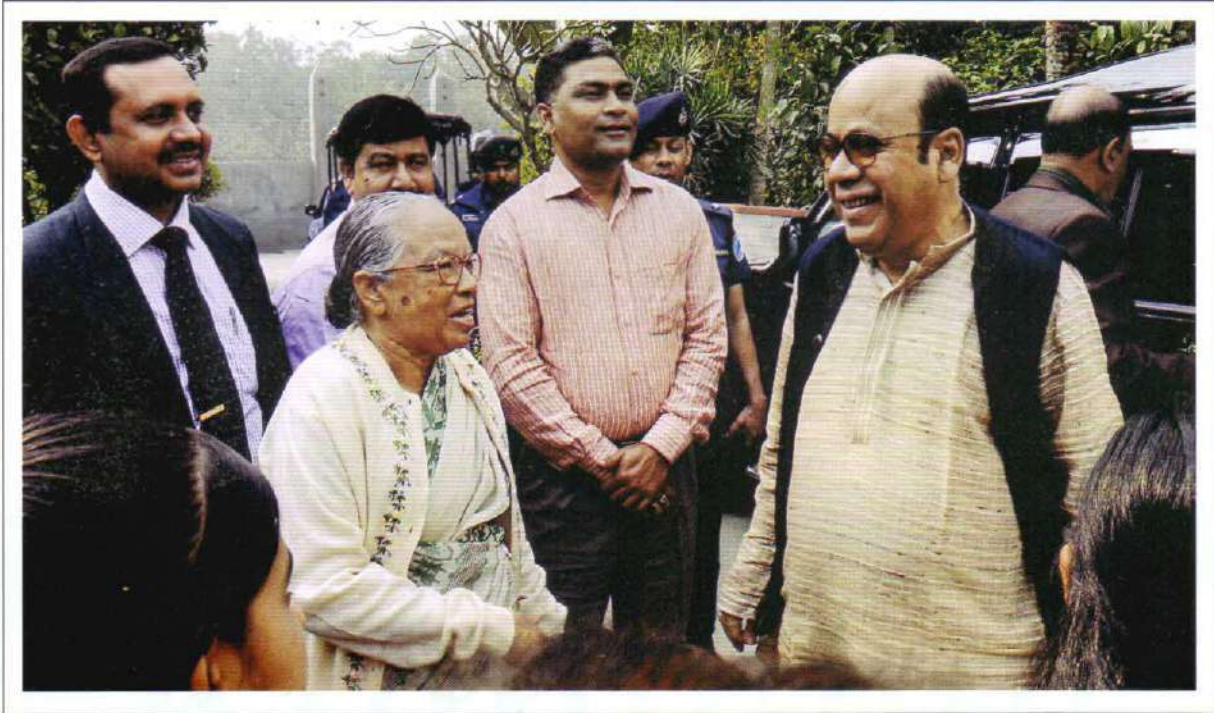
The State Minister for Law Advocate Kamrul Islam while visiting Kumudini Complex at Mirzapur

The State Minister for Law Advocate Kamrul Islam visited Kumudini Hospital & Complex on 16 February 2013. The Minister was pleased to see and observe the clean environment and discipline at the complex. On arrival he was greeted with flowers at the Library premises.