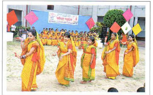
Students rendering songs, performing dances under the open sky

এছাড়াও ছাত্রীরা একটি বর্ণাঢ্য র্যালি নিয়ে কুমুদিনী কমপ্লেক্স প্রদক্ষিণ করে। বর্ষবরণ অনুষ্ঠান শেষে বাংলার চিরাচরিত খাবার পরিবেশন করা হয় সকলের মাঝে।