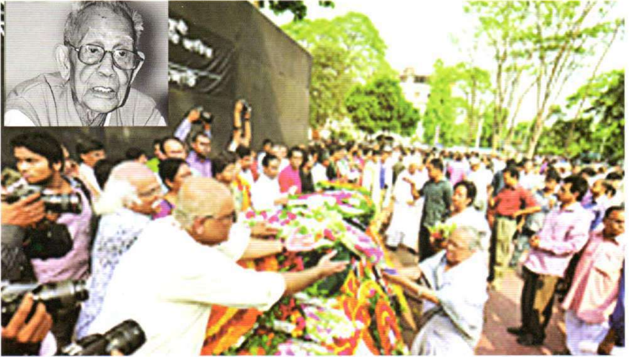
Offering floral wreath on behalf of Kumudini