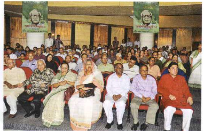
A view of the audience