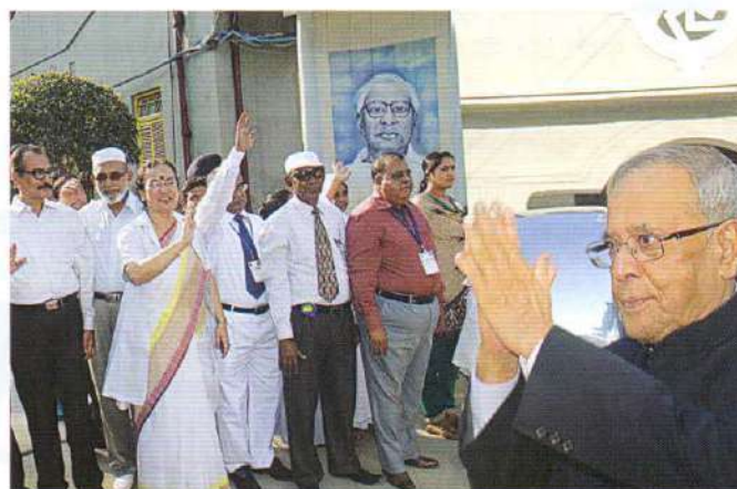
Exchange of good wishes at the time of departure