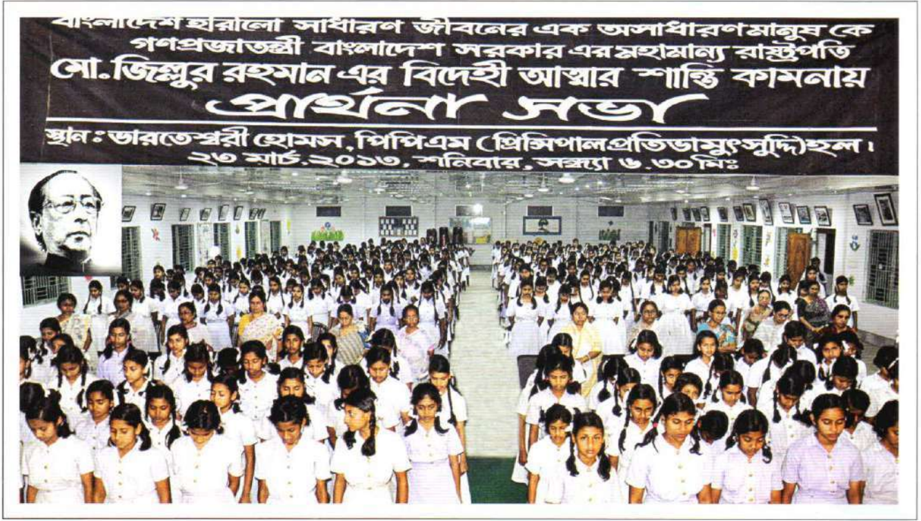
Prayer in silence at PPM Hall of Bharateswari Homes in memory of late President M Zillur Rahman

Condolence and Prayer Meeting in memory of late President M Zillur Rahman