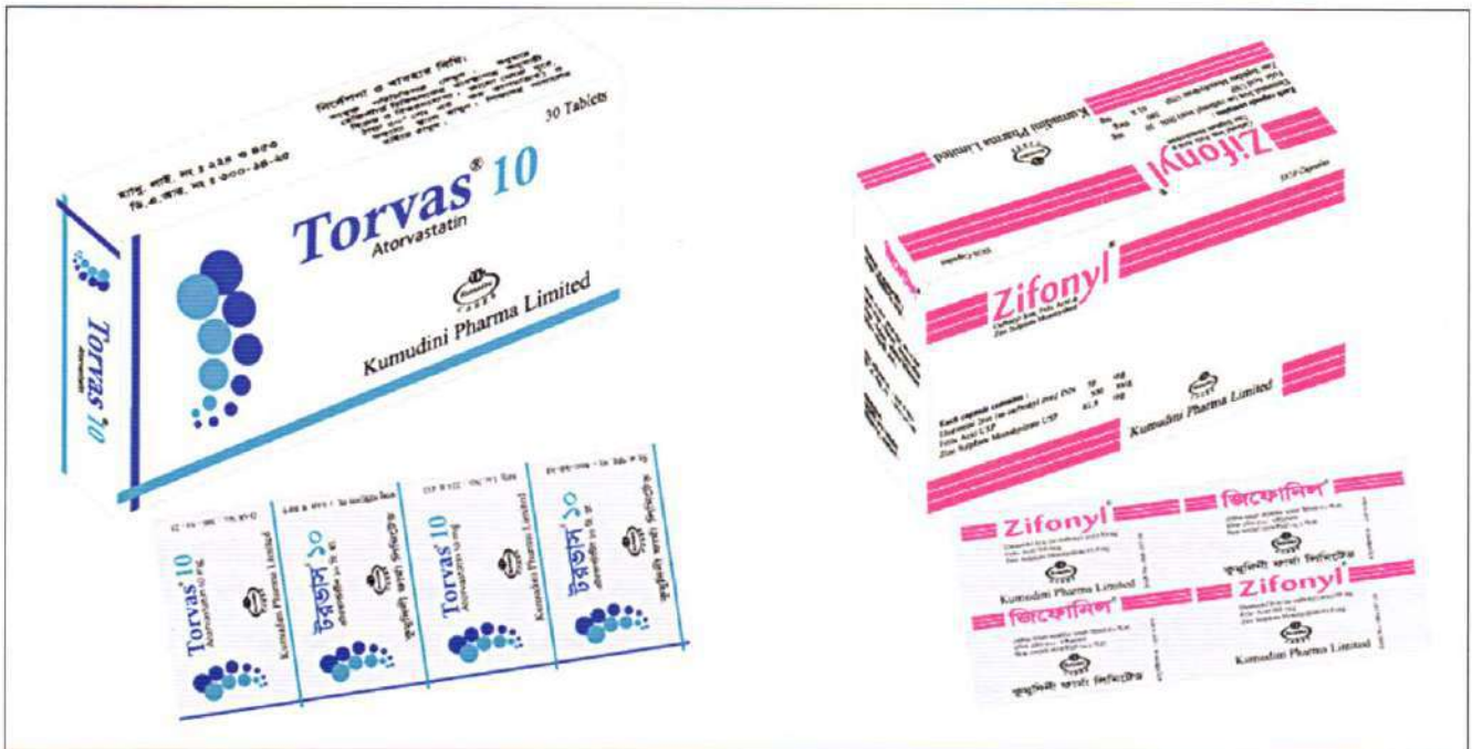
Torvas and Zifonyl

কুমুদিনী ফার্মা লিঃ (কেপিএল) চলতি বছরের মার্চ মাসে টরভাস ও জিফোনিল নামে দুটি ওষুধ বাজারজাত করেছে।