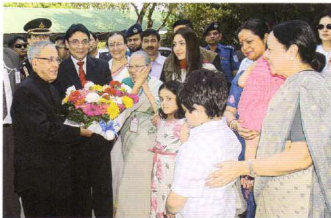
Family members of Kumudini greeting the President