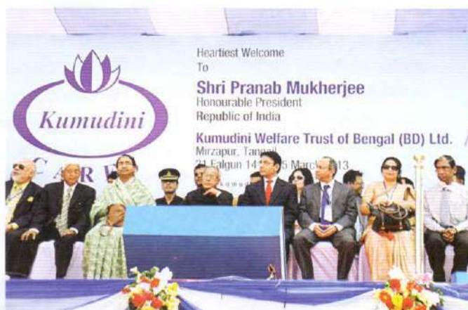
On the dais