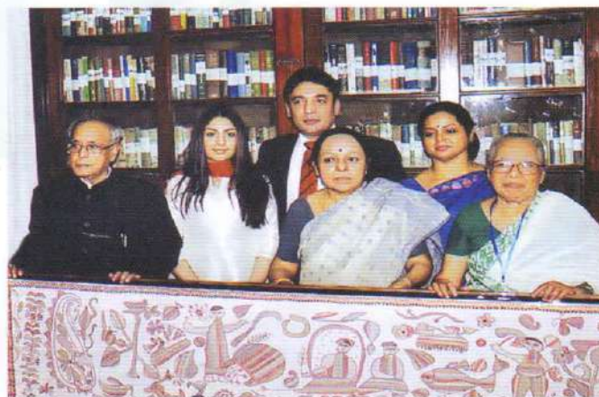
With the core members of Kumudini