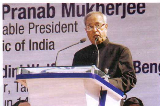
President Shri Pranab Mukherjee addressing the gathering