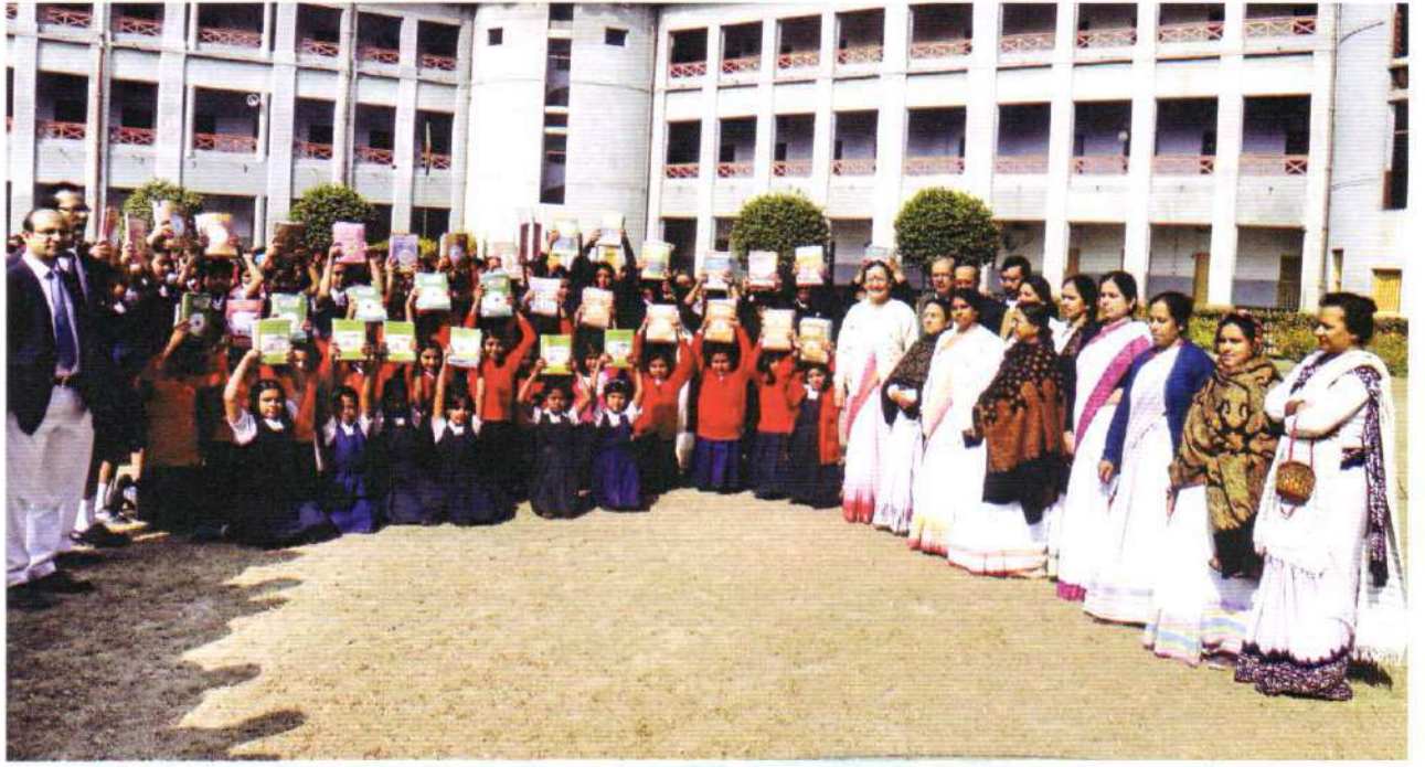
Students rejoicing with new text books in hand

হোমসের অধ্যক্ষা। তিনি তাঁর বক্তব্যে এজন্য শিক্ষা মন্ত্রণালয়কে ধন্যবাদ জানান। দেশের প্রায় পৌনে চার কোটি শিক্ষার্থীর জন্য প্রায় ২৬ কোটি ১৮ লক্ষ নতুন বই ছাপানো, বাঁধাই ও বছরের প্রথম দিন থেকেই বিতরণ শুরু করা বিশাল এক কর্মযজ্ঞ। উল্লেখ্য, ১ জানুয়ারি রাজধানীর রেসিডেনসিয়াল মডেল কলেজে শিক্ষা মন্ত্রীসহ বেশ কয়েকজন মন্ত্রী ও সংসদ সদস্যের উপস্থিতিতে জাতীয়ভাবে 'পাঠ্যপুস্তক উৎসব' উদ্‌যাপনের মধ্যদিয়ে ২০১৩ শিক্ষাবর্ষে শিক্ষার্থীদের হাতে নতুন বই তুলে দেয়ার কার্যক্রম শুরু হয়।