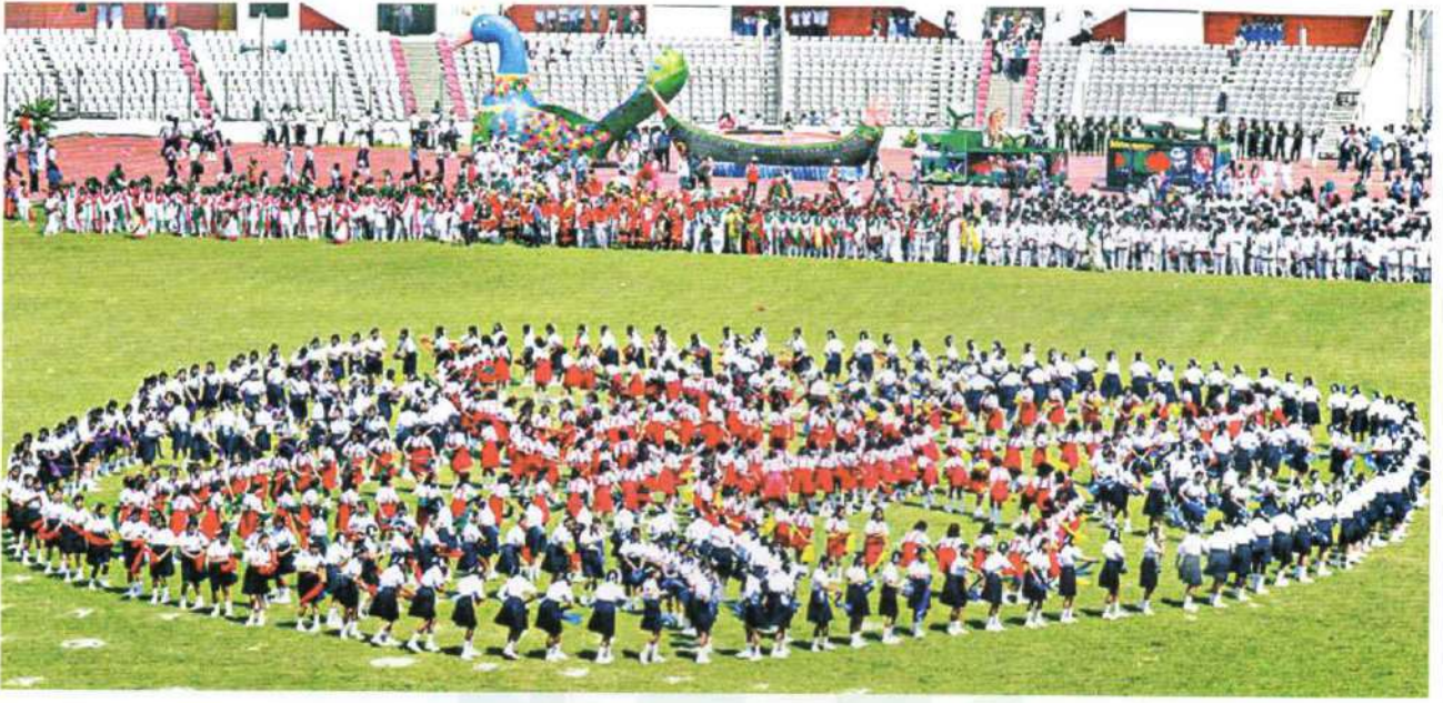
Physical display exhibited by the students of Bharateswari Homes at the Bangabandhu National Stadium on Independence and National Day was one of the main attractions to the spectators

ভারতেশ্বরী হোমসের ছাত্রীরা (জুনিয়র গ্রুপ) শরীর চর্চা প্রদর্শন করে প্রশংসা অর্জন করে।