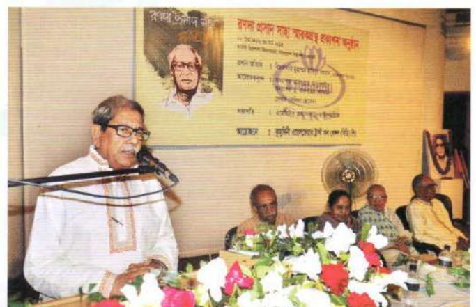
Dr. Anisuzzaman delivering the Presidential speech