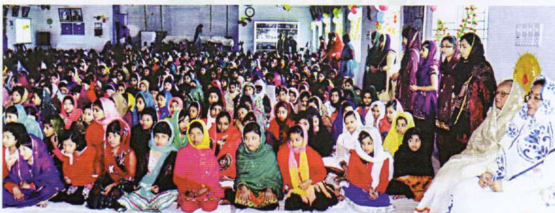
Holy Eid-e-Miladunnabi was celebrated by the Muslim teachers and students of Bharateswari Homes. On this occasion a Melad Mehfil was held on 25 January, 2013.