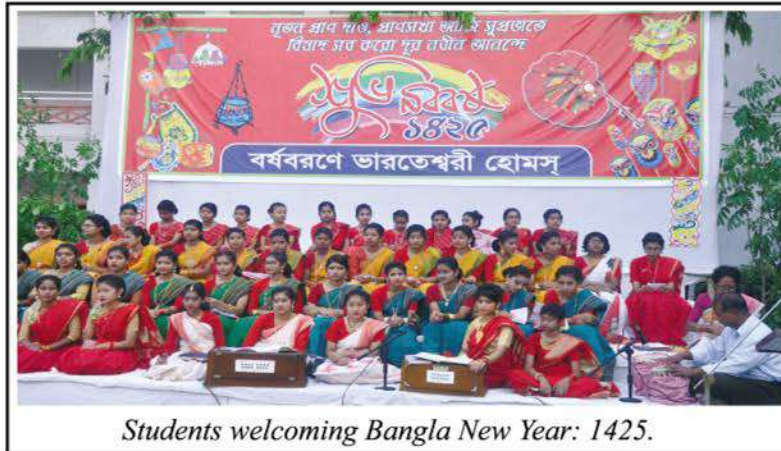
Students welcoming Bangla New Year: 1425.

A three day long Bangladesh–India Poem Festival was celebrated at Tangail from 4 to 6 January. The festival being held for the fourth time took place at the Municipal ground which was participated by more than 400 poets. The festival began with singing of the Tagore song 'Aguner Parashmoni Chao Prane' and illumination of candles. The inaugural song was rendered by the students of Bharateswari Homes. Other two patriotic songs including the famous 'Tumi Nirmal Karo' by Rajoni Kanta Sen and 'Dhane Dhanye Pushpe Bhara' by D L Roy was also sung by the students of Homes. ●