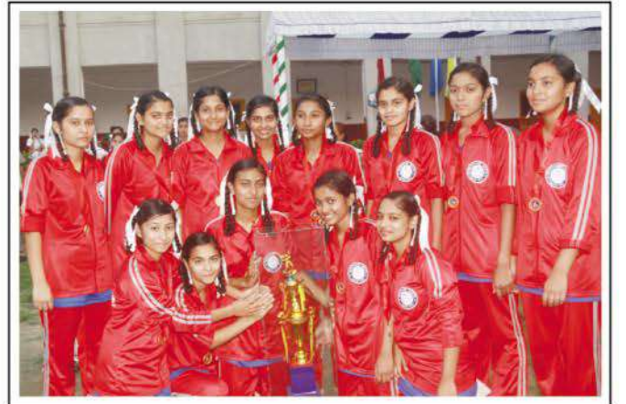
Winning students of Class XI with Trophy.