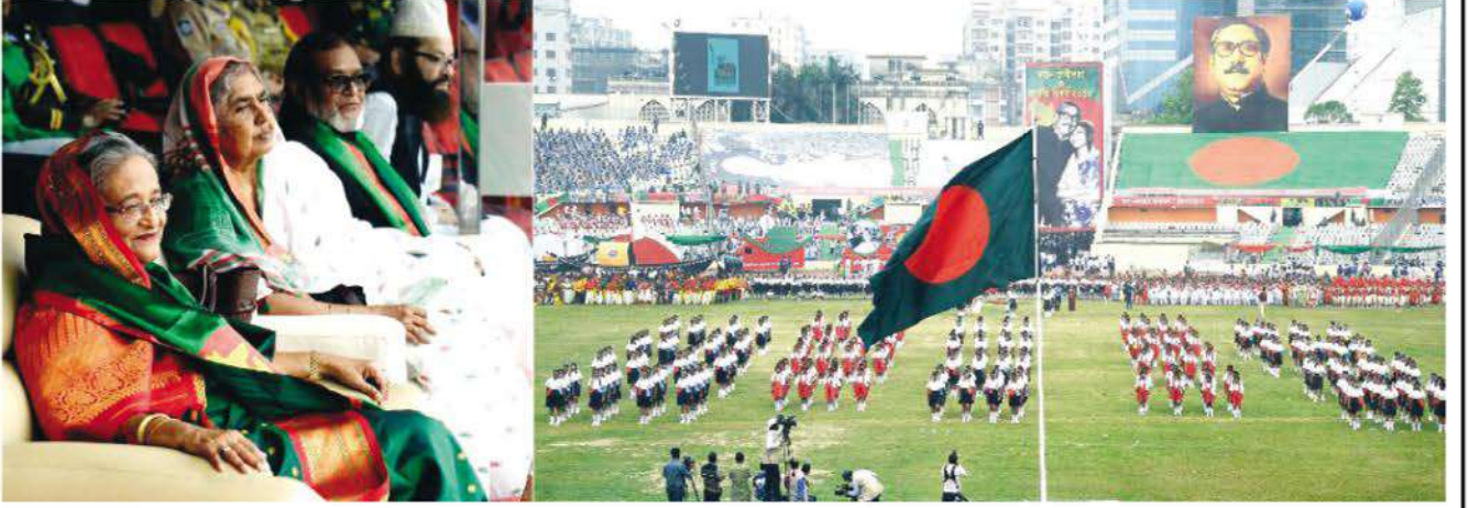
Hon'ble Prime Minister Sheikh Hasina observing physical display performed by Bharateswari Homes students at Bangabandhu Stadium in Dhaka on Independence and National Day.