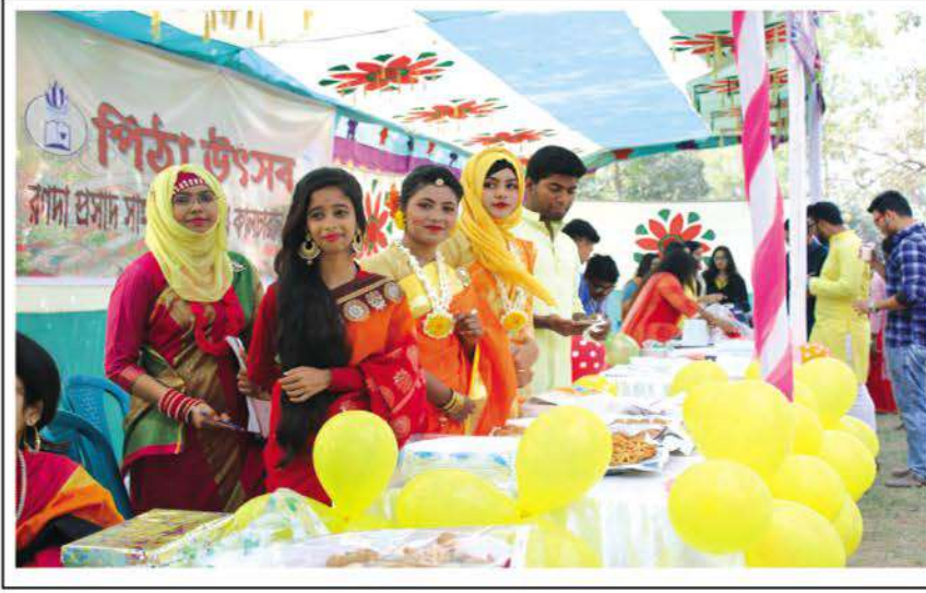
An arrangement of delicious hand-made indigenous cake Pitha.

ফাল্গুনের প্রারম্ভে গত ১২ ফেব্রুয়ারি বিশ্ববিদ্যালয় প্রাঙ্গণে শিক্ষার্থী, শিক্ষক, কর্মকর্তা-কর্মচারীদের উদ্যোগে আয়োজিত হয় বসন্ত উৎসব। এর অনুষ্ঠান হিসেবে ছিল পিঠা উৎসব। উৎসবকে কেন্দ্র করে বিশ্ববিদ্যালয়ের সাংস্কৃতিক সংগঠনের আয়োজনে পরিবেশিত হয় সারাদিনব্যাপী নাচ, গান, আবৃত্তি, নাটক ইত্যাদি। বিশ্ববিদ্যালয় প্রাঙ্গণে বসেছিল নানা ধরনের পিঠা স্টল যেখানে ছাত্রছাত্রীদের নিজ হাতে তৈরি সুস্বাদু পিঠা বিক্রি হয়। ●