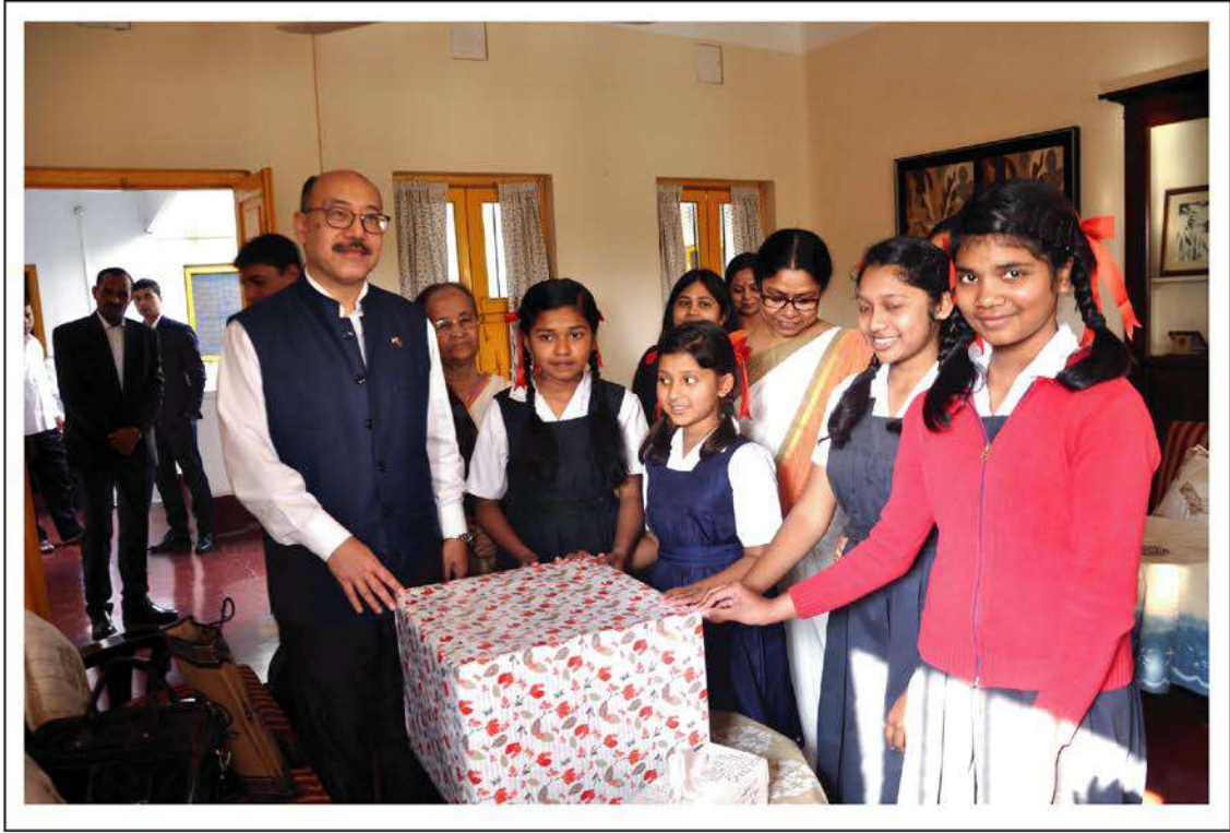
Students of Bharateswari Homes presenting a complimentary gift to the Indian High Commissioner.

In the afternoon the High Commissioner visited the Combined Waste Management System. Later on he joined the officers of Kumudini Complex at a tea party at the library where he exchanged views. ●