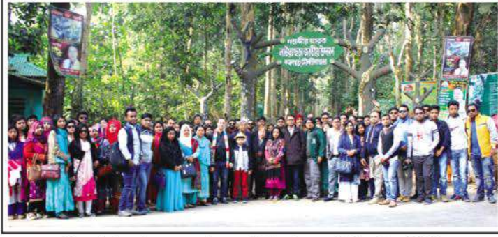
Participating members of the Annual Picnic: 2018 of RPSU at Lauwachhara National Park.

মৌলভীবাজারের লাউয়াছড়া জাতীয় উদ্যানে গত ৮ জানুয়ারি বিশ্ববিদ্যালয়ের বার্ষিক বনভোজনের আয়োজন করা হয়। এ উদ্দেশ্যে ছাত্রছাত্রী, শিক্ষক ও কর্মকর্তাগণ সকলে নারায়ণগঞ্জ থেকে পিকনিকের উদ্দেশ্যে রওনা হয়ে যথাসময়ে সেখানে পৌঁছান। সবুজে ঘেরা মনোমুগ্ধকর প্রাকৃতিক পরিবেশে পিকনিক করতে পেয়ে অংশগ্রহণকারীরা আনন্দে মাতোয়ারা হয়ে উঠেন। পিকনিক শেষে সকলে ঐ দিনই নারায়ণগঞ্জ ফিরে আসেন। ●