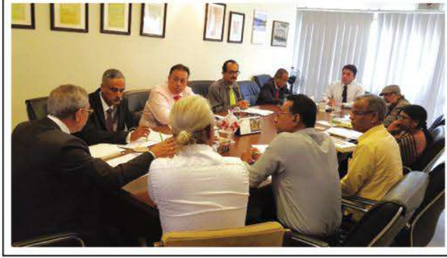
RPSU Syndicate Meeting.