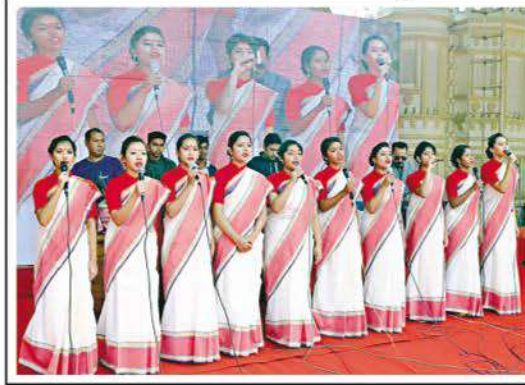
Students of Bharateswari Homes rendering songs in the Poem Festival.

গত ৪-৬ জানুয়ারি টাঙ্গাইল শহরে অনুষ্ঠিত হয় তিনদিন ব্যাপী বাংলাদেশ - ভারত কবিতা উৎসব। পৌর উদ্যানে আয়োজিত এই উৎসবে চারশতাধিক কবি অংশ নেন। এটি ছিল চতুর্থ কবিতা উৎসব অনুষ্ঠানে উদ্বোধনী সঙ্গীত পরিবেশনের জন্য আমন্ত্রিত হয়েছিল ভারতেশ্বরী হোমসের শিল্পীবৃন্দ। তাদের গাওয়া 'আগুনের পরশমনি ছোঁয়াও প্রাণে' এই রবীন্দ্র সঙ্গীতের সঙ্গে মঙ্গলপ্রদীপ প্রজ্জ্বলনের মাধ্যমে কবিতা উৎসবের সূচনা হয়। হোমসের শিল্পী ছাত্রীরা এরপর পরিবেশন করে রজনীকান্ত সেন রচিত 'তুমি নির্মল কর মঙ্গল করে' এবং ডি এল রায় রচিত 'ধন ধান্য পুষ্প ভরা আমাদেরই বসুন্ধরা' গান দু'টি। ●