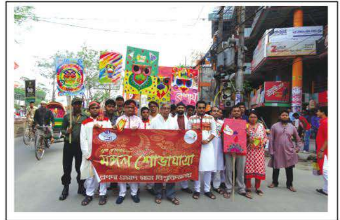
A grand rally of RPSU on Bangla New Year: 1425

The rally which started from the central Shaheed Minar of Narayanganj Pourashava paraded the different streets and finally ended at the university campus. The procession was led by the Vice Chancellor of the university. This was followed by various programmes at the university. ●