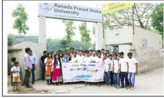
Observance of Rag Day by the students of 1st and 2nd batches.

গত ১৮ মার্চ বিপুল উৎসাহ উদ্দীপনার মধ্য দিয়ে বিশ্ববিদ্যালয়ের প্রথম ও দ্বিতীয় ব্যাচের শিক্ষার্থীদের শিক্ষা সমাপনী উৎসব বা র্যাগ ডে উদ্‌যাপিত হয়েছে। বিশ্ববিদ্যালয়ের ইতিহাসে এটি ছিল প্রথম র্যাগ ডে। এ উপলক্ষে শিক্ষার্থীরা বিশ্ববিদ্যালয় থেকে একটি বর্ণাঢ্য র্যালি বের করেন। র্যালিটি নারায়ণগঞ্জ শহরের বিভিন্ন সড়ক প্রদক্ষিণ করে বিশ্ববিদ্যালয়ে ফিরে আসে। বিকেলে বিশ্ববিদ্যালয়ের একাডেমিক ভবনের সামনে আয়োজন করা হয় মনোজ্ঞ সাংস্কৃতিক অনুষ্ঠানের। অনুষ্ঠানে সংশ্লিষ্ট শিক্ষার্থীরা ফেলে আসা চারটি বছরকে স্মরণ করে সকলের মাঝে তাদের অভিজ্ঞতার কথা তুলে ধরেন। উপাচার্য প্রথম ও দ্বিতীয় ব্যাচের শিক্ষার্থীদের সমৃদ্ধি ও সর্বাঙ্গীণ সাফল্য কামনা করেন। তিনি এই মর্মে আশাবাদ ব্যক্ত করেন যে, পেশাগত জীবনে তারা সুনাম ও দক্ষতার সঙ্গে কাজ করে দেশের কল্যাণে অবদান রাখতে সক্ষম হবেন এবং আরপিএসইউ'র সম্মান বৃদ্ধিতে সহায়ক ভূমিকা পালন করবেন। ●