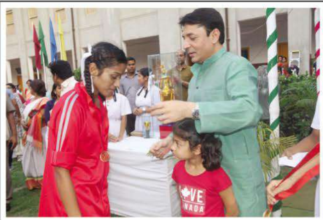
A student is seen receiving medal from Managing Director of KWT.