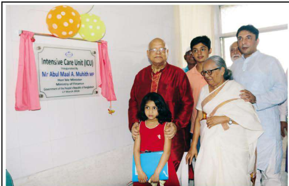
Inauguration of Intensive Care Unit (ICU) at Kumudini Hospital. Mr Abul Maal Abdul Muhit MP, the Hon'ble Minister of Finance, inaugurated the Unit on 17 March, 2018.

disability inclusion training at different places. On 15 th February a team from cbm Australia visited Kumudini Hospital and expressed their satisfaction with the progress of work being undertaken there. ●