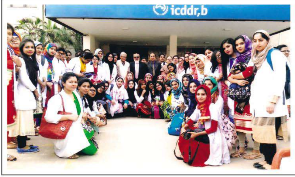
Students of 3rd year MBBS during education tour.