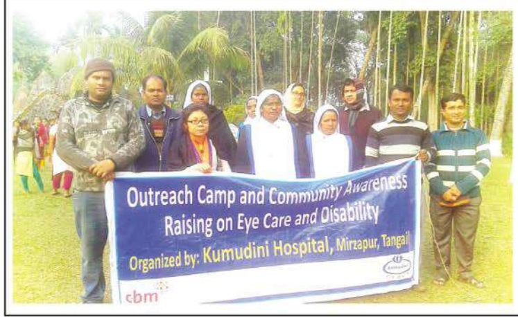
Doctors, nurses and other employees of Kumudini Hospital bringing out a rally in a rural area with a view to creating awareness on eye care and disability among common people.

উল্লেখ্য, গত ১৫ ফেব্রুয়ারি অস্ট্রেলিয়া থেকে সিবিএম-এর একটি প্রতিনিধি দল কুমুদিনী হাসপাতালে সিবিএম প্রকল্পের যাবতীয় কার্যক্রম পরিদর্শন করে সন্তোষ প্রকাশ করেন। ●