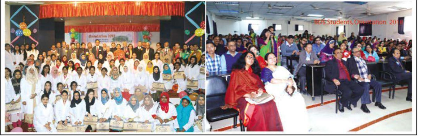
Orientation programme for new MBBS and BDS students.

সম্প্রতি অত্যন্ত উৎসাহ উদ্দীপনার মধ্যে দিয়ে কুমুদিনী উইমেন্স মেডিকেল কলেজের ২০১৭-১৮ শিক্ষাবর্ষের এমবিবিএস এবং বিডিএস কোর্সের প্রথম বর্ষের শিক্ষার্থীদের নবীনবরণ ও পরিচিতি অনুষ্ঠিত হয়েছে।