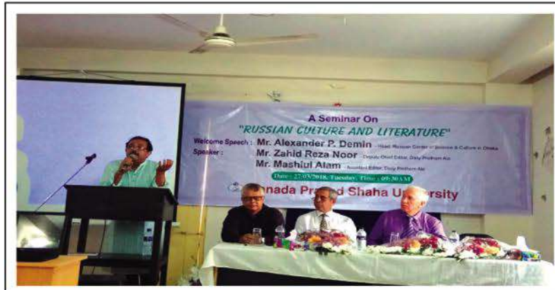
A seminar on Russian Culture and Literature.