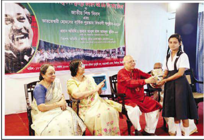
Finance Minister Mr Abul Maal Abdul Muhit MP handing over prize to one of the talent students of Bharateswari Homes.

অর্থমন্ত্রী কমপ্লেক্সে অবস্থিত কুমুদিনী মিউজিয়াম পরিদর্শন করে ভারতেশ্বরী হোমস আয়োজিত অনুষ্ঠানে যোগদান করেন। তিনি হোমসের মাঠে শিক্ষার্থীদের প্রদর্শিত শারীরিক কসরত প্রত্যক্ষ করেন। এছাড়া হোমসের লাইব্রেরিতে তাঁর উদ্দেশ্যে প্রদর্শিত হয় কুমুদিনী উইমেন্স মেডিকেল কলেজ ও হাসপাতাল এর ওপর নির্মিত একটি প্রামাণ্য চিত্র। ●