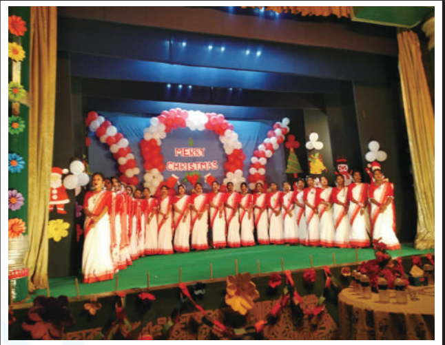
Students of Kumudini Nursing College celebrating Merry Christmas.