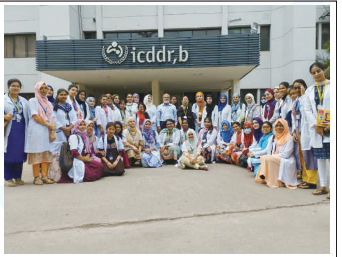
Study tour in different spots and institutions by 3rd year MBBS students of KWMC.