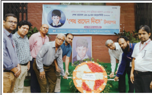
Laying floral wreath at the portrait of Sheikh Russel.

"Sheikh Russel Day" was observed on 18th October 2022 on account of the 58th Birth Anniversary of Sheikh Russel, the youngest son of the Father of the Nation Bangabandhu Sheikh Mujibur Rahman, who was brutally murdered on 15th August, 1975. The day began with the Vice Chancellor, Teachers and students of RPSU laying wreaths on the likeness of Sheikh Russel. Finally, a cake cutting ceremony was held to mark the occasion. ●