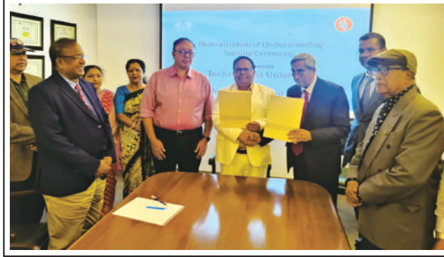
Signing of MoU between R. P. Shaha University and Techno India University, West Bengal, India.