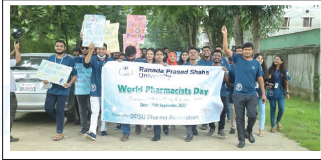
A colourful rally by RPSU Pharmacy Association in observance of the World Pharmacy Day.

In the evening, a cultural programme was held to mark the occasion. ●