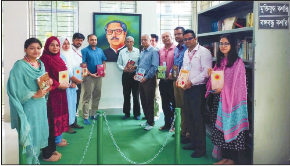
Books on 'Bangabandhu and Liberation War' handed over to the central library of RPSU.