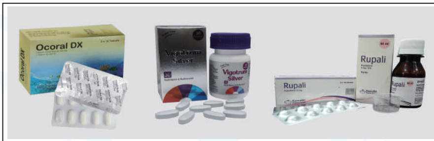
New Drugs marketed by KPL

Vigotrum Silver is a multivitamin and multimineral tablet usually prescribed for individuals aged over 45 who are prone to deficiencies.