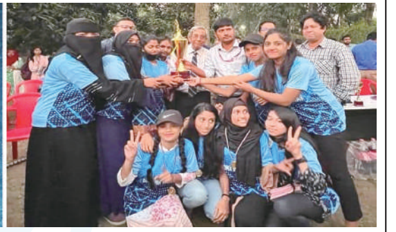
(L) Men's Trophy winner team CSE Elite. (R) Women's Trophy winner team Pharma Victorians.