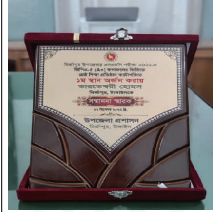
Memento of Excellence conferred on Bharateswari Homes from Mirzapur Upazila Administration for best performance in SSC Examination : 2022

কুমুদিনীর পক্ষ থেকে প্রত্যেক উত্তীর্ণ পরীক্ষার্থীর উজ্জ্বল ভবিষ্যৎ কামনা করি। ●