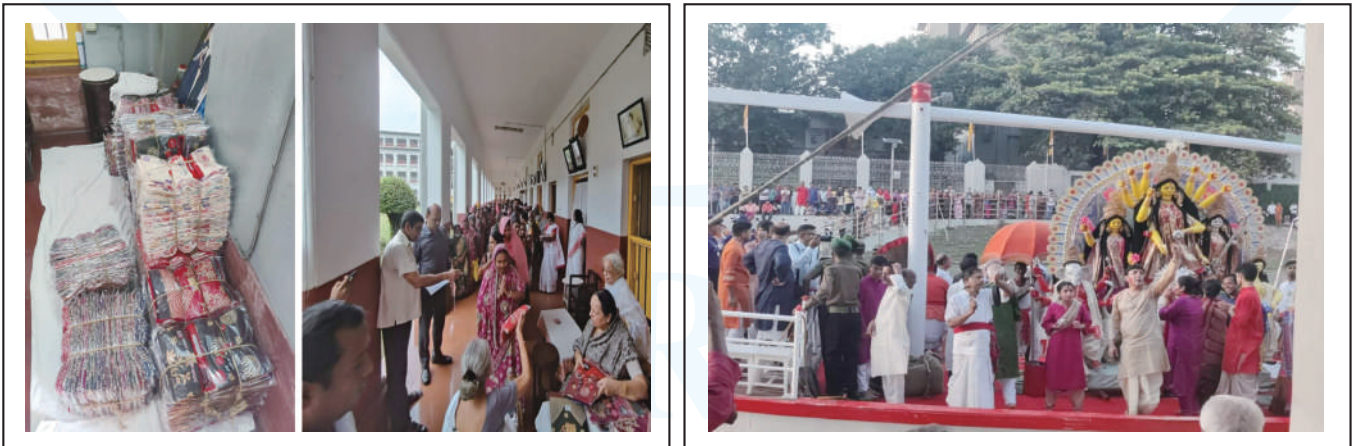
Distribution of Clothes