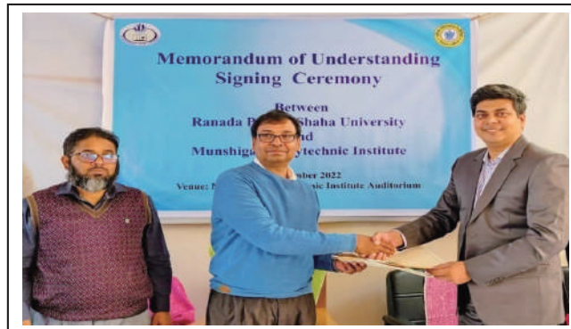
Signing of MoU between R. P. Shaha University and Munshiganj Polytechnic Institute.