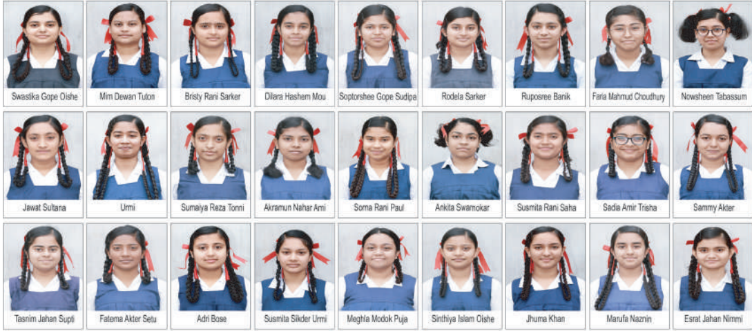
Students who got GPA golden 5.

The Kumudini family congratulates the students on their results and wishes them success in future endeavours. ●