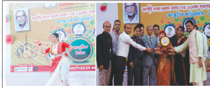
Cultural programme held commemorating the 126th Birth Anniversary.