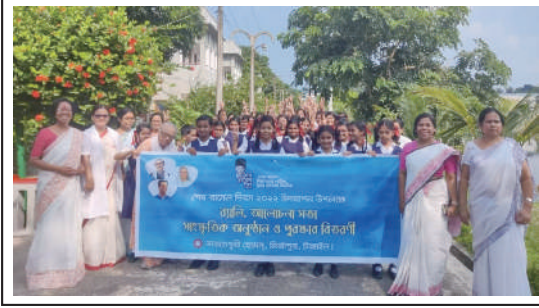
Teachers and students in Mirzapur Campus brought out a colourful rally on the occasion of Sheikh Russel Day.

No. 32 Road in Dhanmondi. He was brutally murdered on 15th August 1975 by the same traitorous group of killers who murdered the Father of the Nation. ●