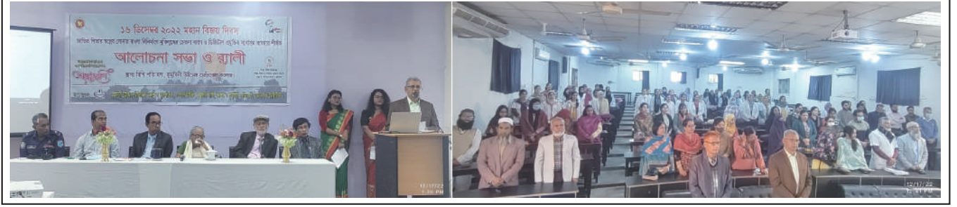
'The role of Digital Technology in disseminating Father of the Nation's Dream for a Golden Bengal'- a discussion meeting held at KWMC.