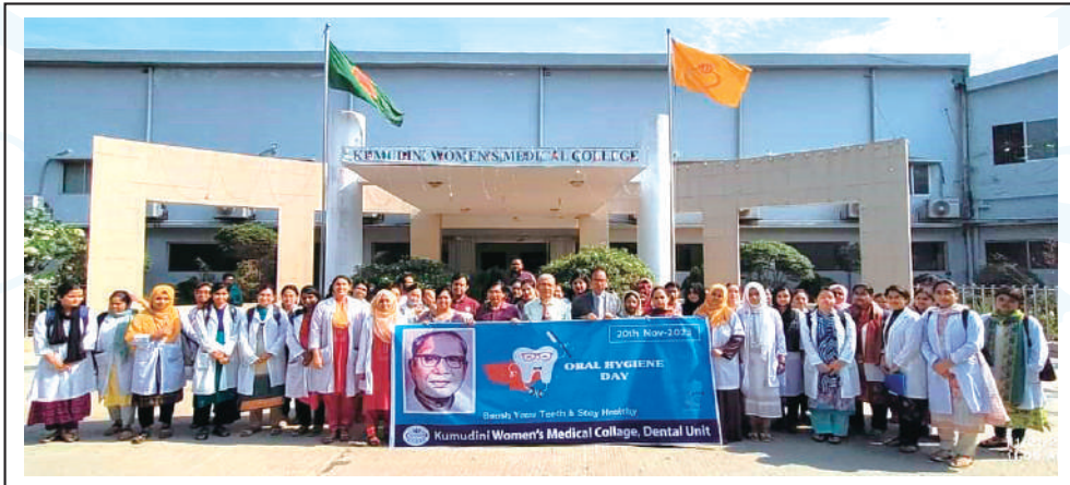
Rally to mark the Oral Hygiene Day.