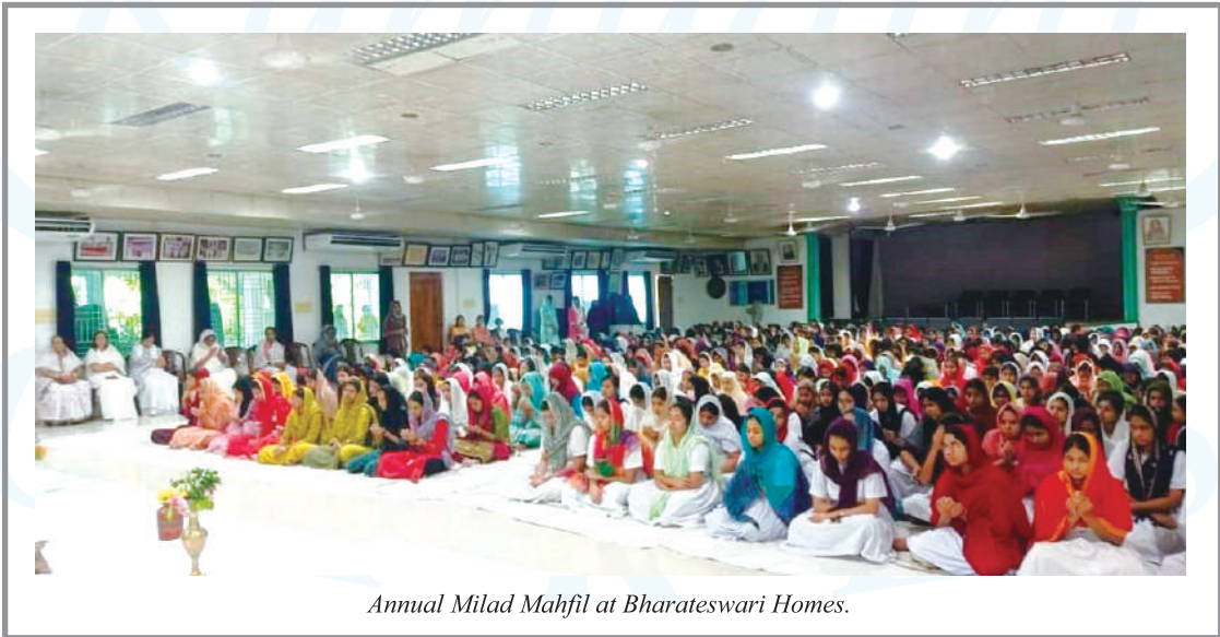
Annual Milad Mahfil at Bharateswari Homes.