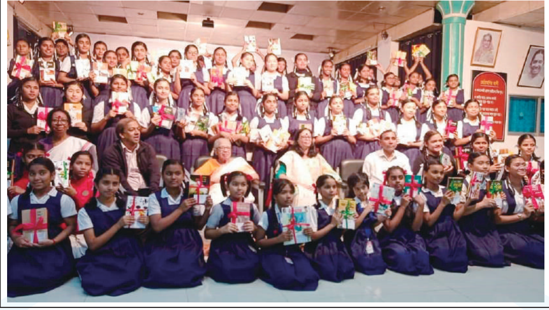
Performers with awards in the prize distribution ceremony of Bharateswari Homes.