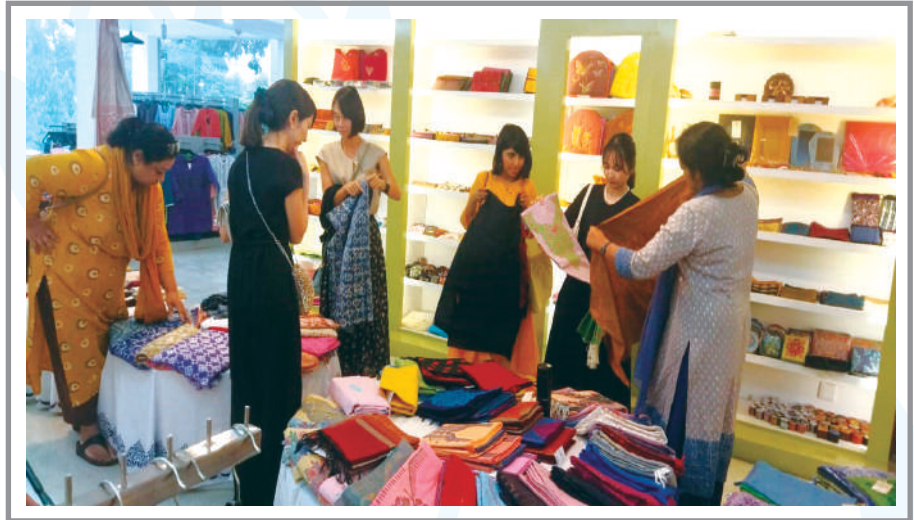
Visiting female members of Japan Embassy looking egerly the excellence of Kumudini's handicraft products. -5 Oct 2023