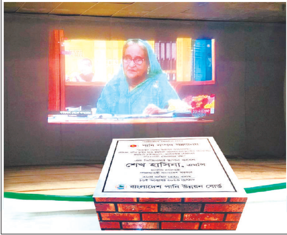
Prime Minister Sheikh Hasina inaugurating the Lauhajong river "Erosion Prevention Project" from Gono Bhabon through video conference.

Lauhajong River Embankment Foundation Stone Laid by PM Sheikh Hasina