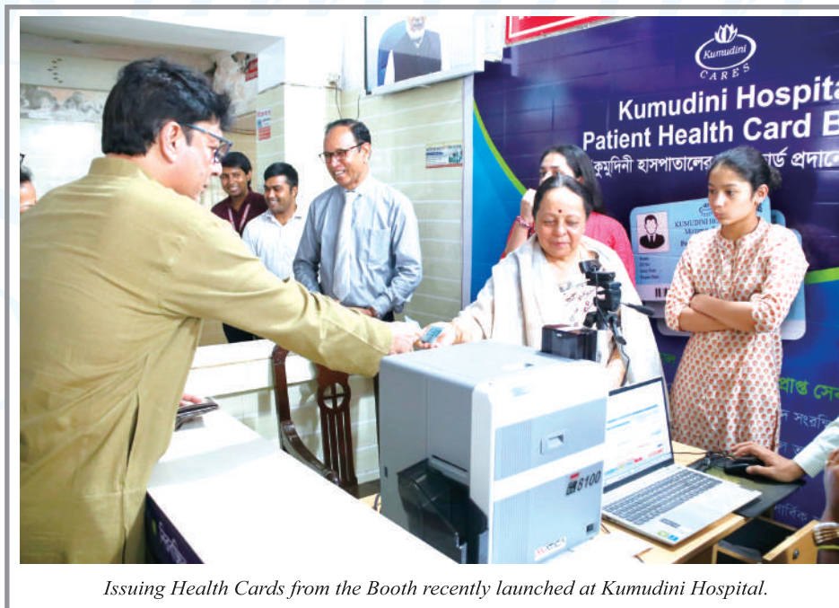
Issuing Health Cards from the Booth recently launched at Kumudini Hospital.