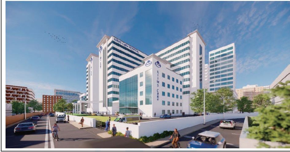
Proposed KIIMS CaRe Hospital.

গত ৮, ৯ ও ১০ই অক্টোবর নারায়ণগঞ্জে কুমুদিনীর নতুন স্বাস্থ্য প্রকল্প KIIMS CaRe বাস্তবায়নকল্পে ঢাকায় কুমুদিনী ওয়েলফেয়ার ট্রাস্টের গুলশান অফিসে উক্ত প্রকল্প সম্পর্কিত ডিজাইন ফিডব্যাক মিটিং ও ওয়ার্কশপ অনুষ্ঠিত হয়।