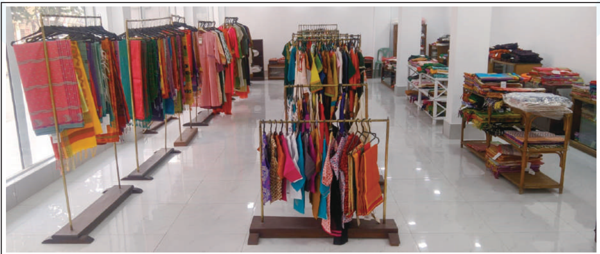
Showroom and Sales Centre of Kumudini Handicrafts at Mirzapur.

Most of the workers in Kumudini Handicrafts are women. Along with permanent workers, there are contractual and daily wage workers. In addition, there are several thousand workers spread over the rural areas of the country. ●