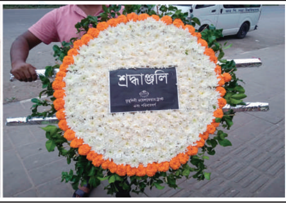
Tribute to Brigadier Dr M A Malik (Retd) on behalf of KWT.

জাতীয় অধ্যাপক ব্রিগেডিয়ার জেনারেল (অব:) অধ্যাপক ডা. এম এ মালিক ৫ই ডিসেম্বর মিরপুরে তাঁরই প্রতিষ্ঠিত ন্যাশনাল হার্ট ফাউন্ডেশনে মৃত্যুবরণ করেন। দেশের এই প্রথিতযশা হৃদরোগ বিশেষজ্ঞ অধ্যাপক ডা: মালিকের মৃত্যুকালে বয়স হয়েছিল ৯৪ বছর। তাঁর জন্ম সিলেটের দক্ষিণ সুরমা উপজেলায় ১৯২৯ সালে পহেলা ডিসেম্বর। অধ্যাপক মালিক ২০০৪ সালে স্বাধীনতা পদক ও ২০০৬ সালে জাতীয় অধ্যাপক হিসাবে নির্বাচিত হন।