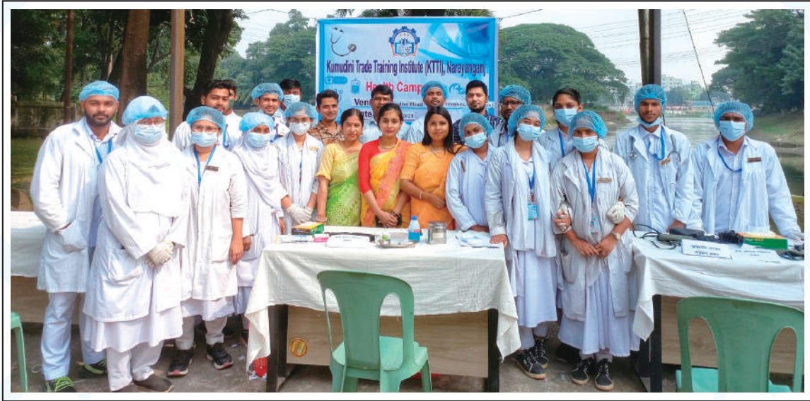
Free Health Campaign initiated by KTTI at Kumudini Complex, Narayanganj.

কুমুদিনী ট্রেড ট্রেনিং ইনস্টিটিউট (KTTI) এর উদ্যোগে গত ৮ নভেম্বর ‘ফ্রি হেল্থ ক্যাম্পেইন’ এর আয়োজন করা হয়। নারায়ণগঞ্জে কুমুদিনী কমপ্লেক্স প্রাঙ্গণে অনুষ্ঠিত এই ক্যাম্পেইনের উদ্দেশ্য ছিল বিনামূল্যে সর্বসাধারণের ব্লাড প্রেসার, ব্লাড সুগার, ব্লাড গ্রুপিং, অক্সিজেন লেভেল পরীক্ষা, নাড়ি পরীক্ষা ইত্যাদি।