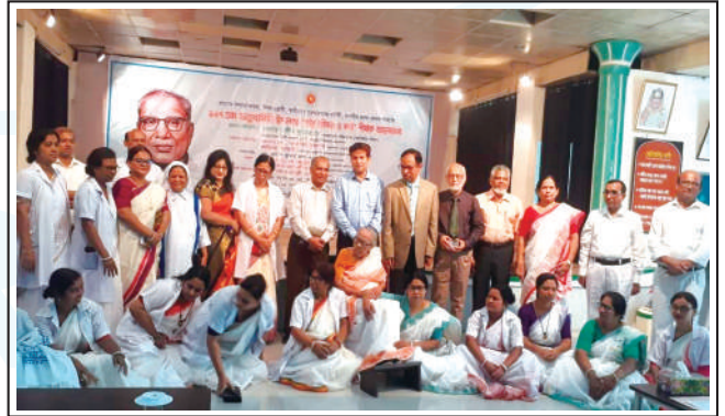
Artist Welfare Trust under the Ministry of Cultural Affairs celebrating anniversary programme at Mirzapur Complex.