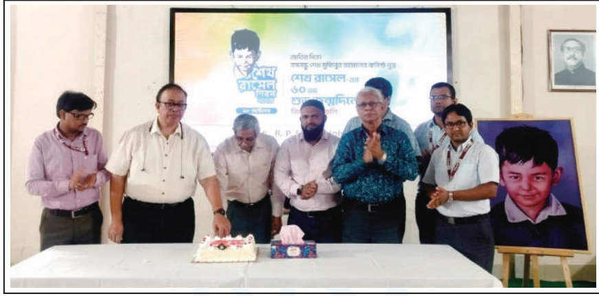
Celebration of Sheikh Russel's 60 th birthday.

যথাযোগ্য মর্যাদায় গত ১৮ অক্টোবর বিশ্ববিদ্যালয় ক্যাম্পাসে জাতির জনকের কনিষ্ঠ পুত্র শহীদ শেখ রাসেলের ৬০তম জন্মদিন উদ্‌যাপিত হয়। দিবসটির মূল প্রতিপাদ্য বিষয় ছিল 'শেখ রাসেল দীপ্তিময়, নির্ভীক নির্মল দুর্জয়'। অনুষ্ঠানের শুরুতে শেখ রাসেলের উপর নির্মিত একটি প্রামাণ্য চিত্র প্রদর্শন করা হয়।