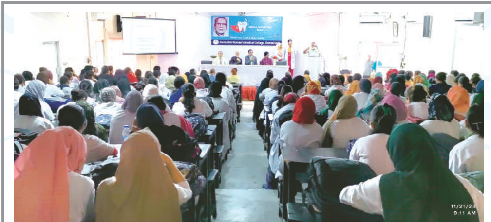
A seminar organized at Kumudini Women's Medical College on the occasion of Oral Hygiene Day.