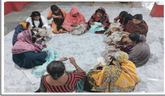
Local women of Mirzapur are busy at embroidery work.