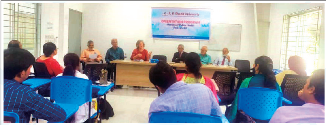
Fall-2023 Semester : Orientation Programme of MPH course at RPSU.

আর পি সাহা বিশ্ববিদ্যালয়ে Fall 2023 সেমিস্টারে কুমুদিনী স্কুল অব পাবলিক হেল্থ অনুষদের অধীনে মাস্টার্স অব পাবলিক হেল্থ (MPH) প্রোগ্রাম চালু হয়েছে। ক্লাস শুরু হয়েছে পয়লা অক্টোবর থেকে। অভিজ্ঞ শিক্ষকদের তত্ত্বাবধানে প্রথম সেমিস্টারে ১৭ জন দেশী-বিদেশী শিক্ষার্থী ভর্তি হয়েছেন।