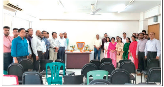
Celebration at KPL's Aftab Nagar office, Dhaka.