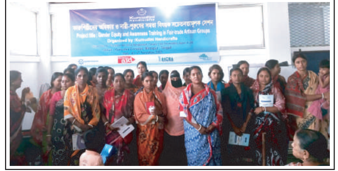
Gender Equity and Awareness Training in Fair-Trade Artisan Groups organized by Kumudini Handicrafts at Kumudini Complex, Mirzapur. - 3 to 7 Nov 2023

A new sub-production centre of Kumudini Handicrafts has been started from 13 January at Tantighar located in Mirzapur Kumudini Complex. Handicrafts like embroidery, block, boutique, screen printing etc. are being done here.