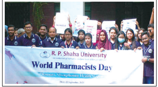
Rally brought out to mark the World Pharmacists Day.