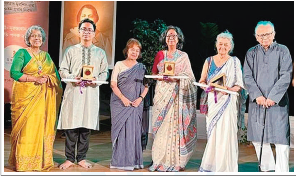
Receivers of Noorjahan Murshid Commemorative Medal.