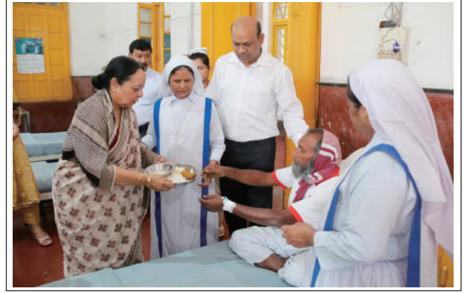
Kumudini family members serving improved meals to the patients at Kumudini Hospital.